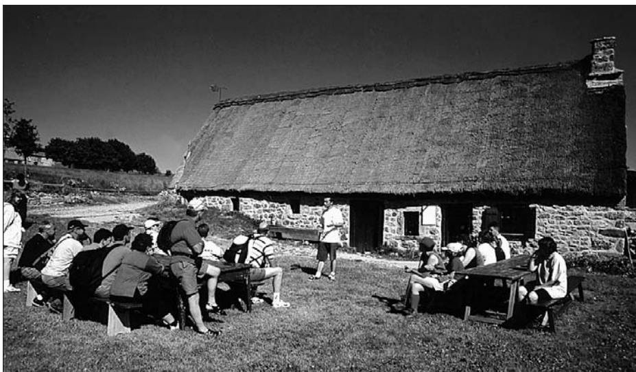
Animation Jasserie du Coq Noir. Parc naturel régional du Livradois-Forez.

Il convient de rappeler que les pouvoirs publics commanditaires (DATAR) cherchent à accompagner le développement rural de façon efficace. Dans le schéma de pensée actuel, la performance du secteur d'activité passe par une offre de produits et services de qualité, des entreprises compétitives, des professionnels formés. Reste à savoir si l'ensemble de ces concepts est représentatif des