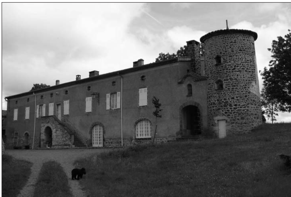
Gîte de groupe. Domaine de Chagourdat dans le Puy deôme.

Cette catégorie choisit l'hébergement touristique à la campagne comme élément d'un projet de vie : « Il arrive un moment où l'on aspire à autre chose. Donc, on a cherché une méthode pour changer un peu de style de vie ; on avait envie de revenir en