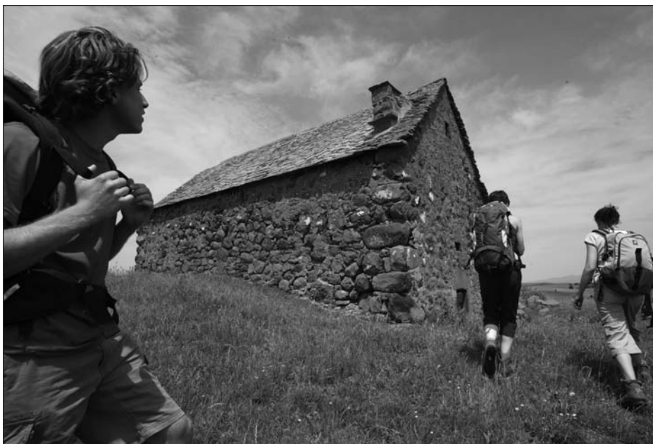
Randonnée dans le Cantal.

Gîtes ou chambres d'hôtes constituent, nous le pensons, des produits bien différents. Cependant, leur rattachement à tel ou tel