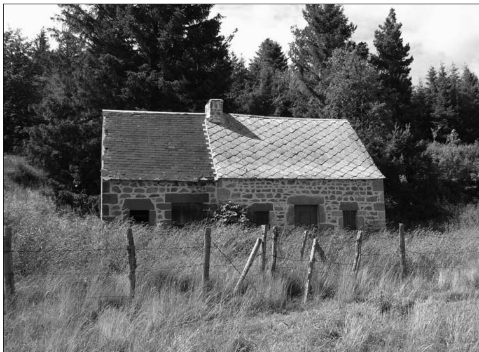
Un buron d'estives à réouvrir aux visiteurs. Puy de Dôme.