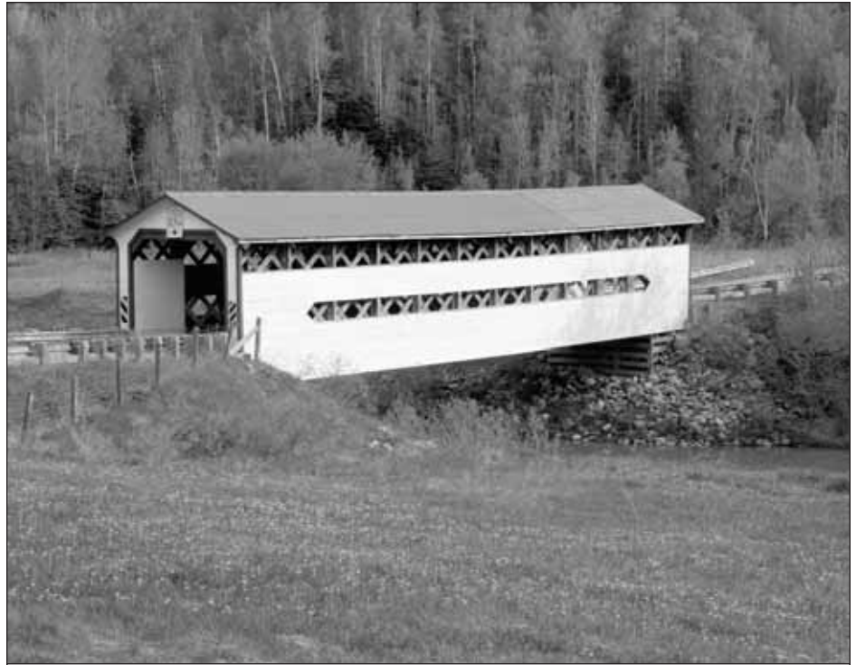
Pont couvert Dénomée, Saint-Bruno-de-Guigues, Abitibi-Témiscamingue.

Il est assez largement reconnu aujourd'hui que le produit touristique peut être l'ensemble des activités réalisées par le touriste à partir du moment où celui-ci quitte son espace habituel de vie et ce, jusqu'à ce qu'il y retourne. Pour plusieurs, le produit touristique correspond ainsi à l'ensemble du périple. Les diverses consommations