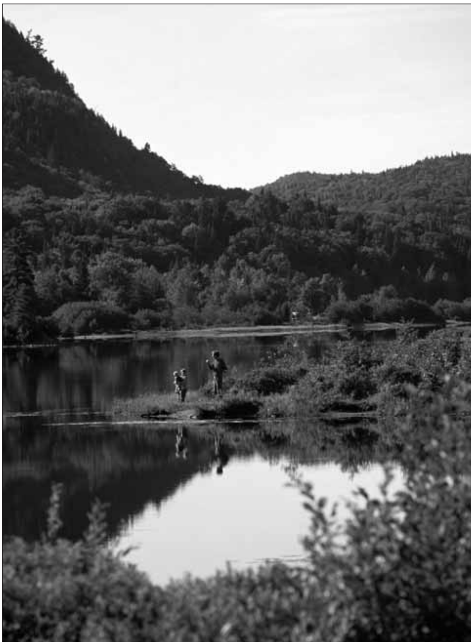
Laurentides, Parc national du Mont-Tremblant, Laurentides.

Tel qu'indiqué dans l' Encyclopédie du tourisme (Jafari, 2000), tout ce qui est acheté lors d'un voyage peut être appelé un produit touristique. Plus exactement « un produit est tout ce qui peut être offert pour satisfaire un besoin ou un désir » (Kotler et al., 2000 : 10). Il y a des cas où le concept de produit s'applique aussi à des services gratuits, comme certains loisirs (exemple : une balade à vélo), ou à des biens publics (un paysage), donc où le produit ne nécessite pas une transaction explicite entre un