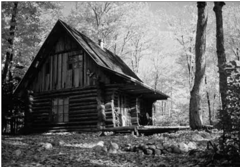
Maison en bois rond, Laurentides.