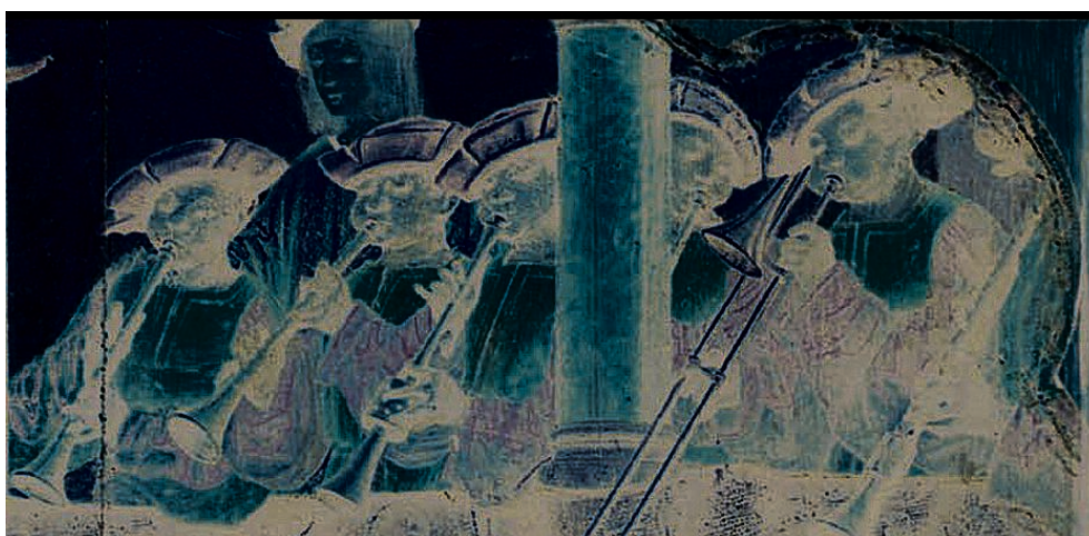
CRISTÓVÃO DE FIGUEREDO, ABA LATERAL DOS "PAINÉIS DE ST a AUTA" DO CONVENTO DA MADRE DE DEUS EM LISBOA. ÓLEO S/ MADEIRA, 1520 MUSEU NACIONAL DE ARTE ANTIGA, LISBOA

Orquestra de negros no balcão de uma sala de festas