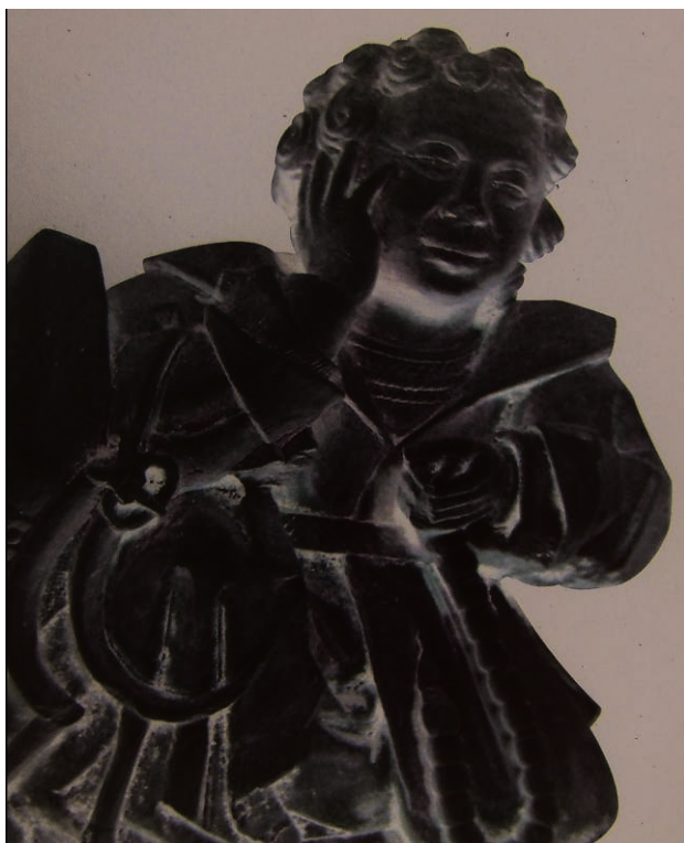
TÚMULO EM CALCÁRIO DE DIOGO DE AZAMBUJA, FUNDADOR DO CASTELO DA MINA, C.1515 MONTEMOR-O-VELHO, IGREJA DE N a SR a DOS ANJOS.

Rosto de moço-de-esporas negro (Serra Leoa ou Mina) sentado aos pés do seu senhor