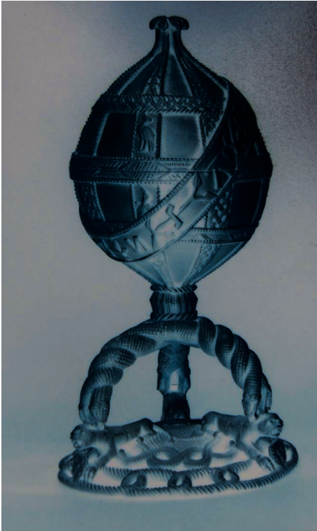
SALEIRO DE DUAS CAVIDADES EM FORMA DE ESFERA ARMILAR. MARFIM, 21 CMS. MUSEUM FÜR VÖLKERKUNDE, BERLIM