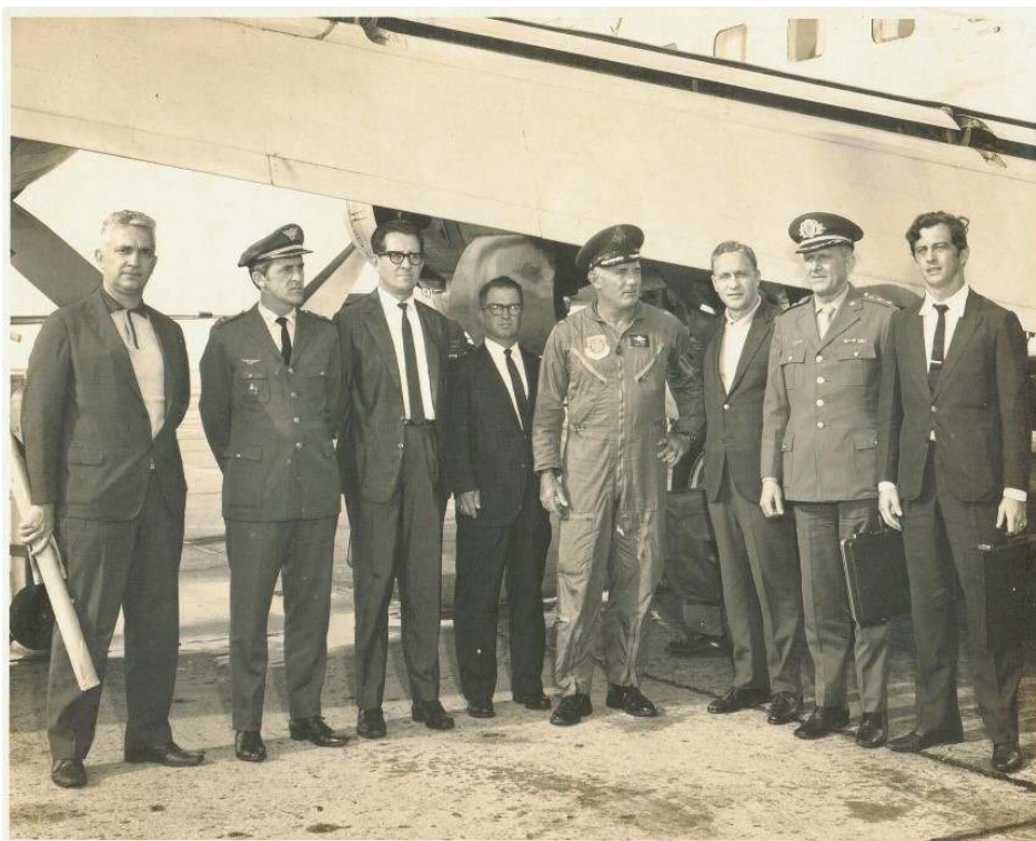
Figura 5. Equipe mista AST10 BRASIL-EUA