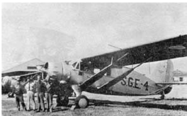
Figura 2. Aeronave Bellanca