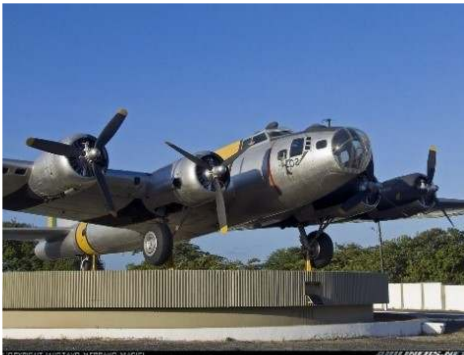
Figura 4. B17: “Fortaleza Voadora” – Aeroporto de Recife