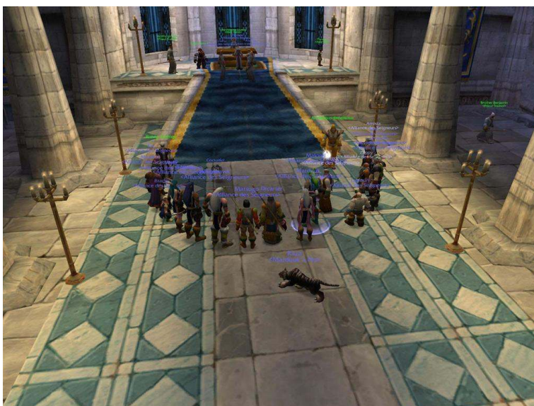
Fig. 1 . Célébration du mariage de l'Alliance des seigneurs dans la cathédrale du Hurlevent.

Dans le présent cas, ils se sont rendus à la cathédrale au cœur de Hurlevent. Le maître de guilde préside la cérémonie d'engagement, première spécificité, et à la sortie les mariés sont salués par l'ensemble du groupe agenouillé, deuxième spécificité originale. Certes la guilda est limitée par les contraintes de l'ordinateur. Il n'y a pas de possibilité avec le logiciel de lancer du riz ou d'autres choses, les joueurs créent donc avec les contraintes que leur impose la technique. Dans ce cas précis, la guilda va saluer les mariés en se plaçant en deux haies d'honneur parallèles au sortir de l'édifice. À l'image de la Guilda, le mariage va travailler la forme. L'Alliance des seigneurs va tout d'abord créer une histoire, va se raconter elle-même à travers l'événement. Ici le mariage est directement lié à la création de la guilda. On institue un collectif de jeu, dans un esprit de jeu de rôle, et d'emblée on célèbre ensemble le mariage de deux d'entre eux.