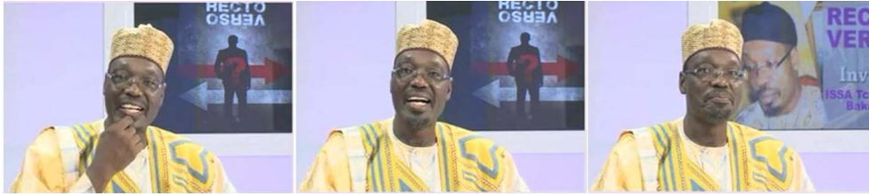
im. 1 : Attitude A-B-H (lignes 20-21) + regard au loin