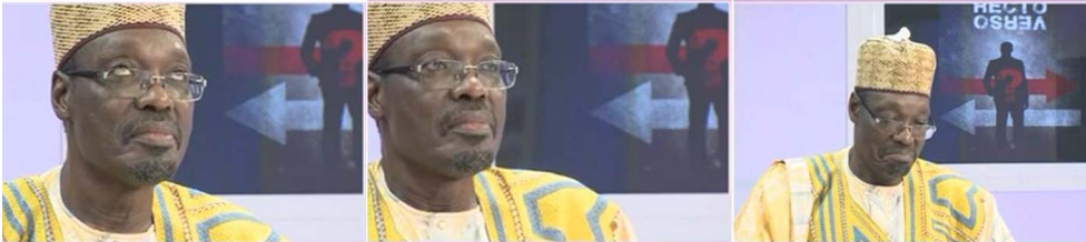
im. 4 : Attitude G-O-L (ligne 38)