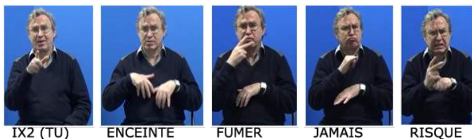
Figure 6. Énoncé (5) en images