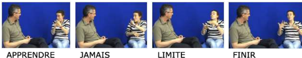
Figure 10. Énoncé (9) en images, corpus Creagest (L'Huillier et al., 2016)

74 Dans ces deux exemples, le non-ancrage spatial, couplé au non-marquage explicite (sujet nul), exprime un degré maximal d'impersonnalité et de généralité.