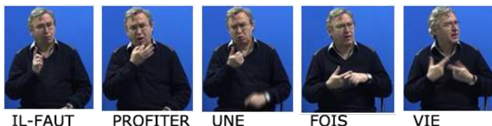
Figure 9. Énoncé (8) en images