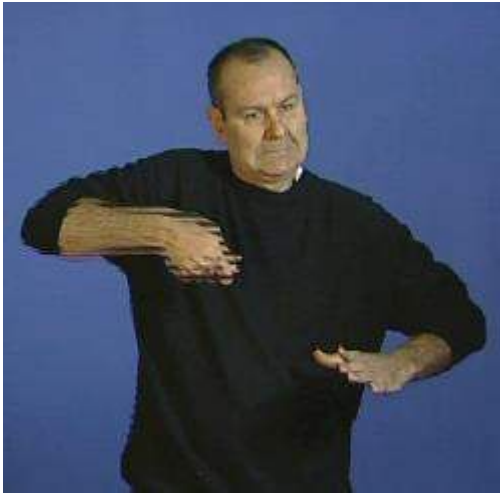
Figure 7. Énoncé (6) en image, transfert personnel prescriptif du cuisinier, corpus LS-COLIN (Cuxac et al., 2002)

62 C'est cette même structure que nous avons identifiée, à une seule reprise toutefois, dans notre corpus de données élicitées. Il s'agit de la phrase-cible « On fait le rhum avec de la canne à sucre » que nous assimilons à un cas d'universel non restreint comme indiqué plus haut, comme l'illustre l'énoncé 7 et la Figure 8 :