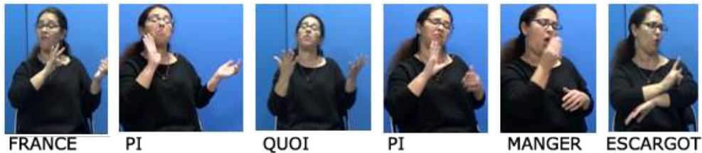
Figure 5. Énoncé (3) en images