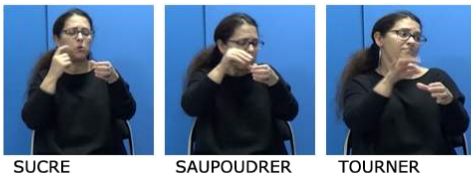
Figure 8. Énoncé (7) en images

64 (Tu saupoudres de sucre, tu tournes, comme ça »)