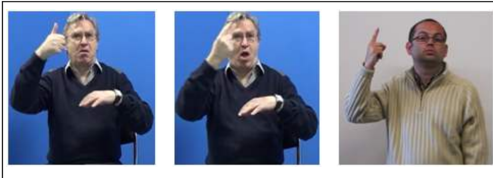
Figure 1. Le marqueur UN (QUELQU'UN) en LSF (variante avec pouce – image de gauche - et avec index – image du centre) et en LSC (image de droite, in Barberà & Quer, 2013 : 246)

variante la moins courante, avec l'index relevé (comme en LSC, Barberà & Quer, 2013), une légère rotation du poignet et une labialisation distincte /quelqu'un/. Il est employé seul, et non comme déterminant ou numéral devant un nom (sauf dans le cas particulier de l'énoncé (2) que nous décrivons plus bas). Dans cette séquence, il a clairement une valeur indéfinie équivalant au sens de « quelqu'un » et correspond au someone anglais ou au jemand allemand. Ceci justifie notre choix de le gloser UN (QUELQU'UN).