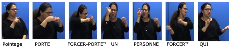
Figure 3. Énoncé (2) en images

42 Contrairement aux exemples de la Figure 2, le signe UN de la Figure 3 peut être analysé comme déterminant indéfini et singulier. Ainsi, on a ici un syntagme nominal 'une personne' évoquant une construction similaire à celle identifiée, par exemple, dans la TID (LS turque) comme stratégie typique pour encoder les sujets impersonnels humains (Özkul & Kelepir, 2015 :10). Toutefois, cette construction, peu fréquente en LSF, nous a posé question. Elle n'apparaît en effet qu'une fois dans notre corpus de données élicitées. En outre, la séquence UN+PERSONNE reflète assez exactement les deux composants « quelque » et « un » du mot français « quelqu'un » qui était présent dans