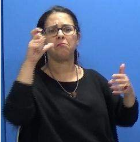
Figure 2. Le marqueur PERSONNE en LSF

39 Il est intéressant d'observer, en outre, que le signe PERSONNE peut apparaître dans une distribution différente. Dans un contexte d'existentiel vague (avec la phrase-cible « Quelqu'un a forcé la porte de ma maison »), ce signe n'apparaît pas comme seul marqueur de l'impersonnalité mais avec plusieurs autres éléments. C'est ce que nous voulons illustrer par l'énoncé (2) et la Figure 3. Cet exemple, particulièrement riche mais qui n'apparaît qu'une fois dans notre corpus, se décompose comme suit : le signe PERSONNE est non seulement précédé par le signe UN mais aussi suivi du signe QUI en fin d'énoncé. Par ailleurs, cette construction UN+PERSONNE est produite entre deux transferts personnels (annotés TP ) dans lesquels le locuteur incarne la personne – non connue – en train de forcer la porte. Le signe QUI, qui clôt l'énoncé (2), prend une valeur de « fausse question », insistant sur le caractère vague de la référence. L'énonciateur n'a en effet pas connaissance de l'identité du référent, qu'il incarne pourtant en transfert personnel ; il ne sait pas qui a forcé la porte de sa maison.