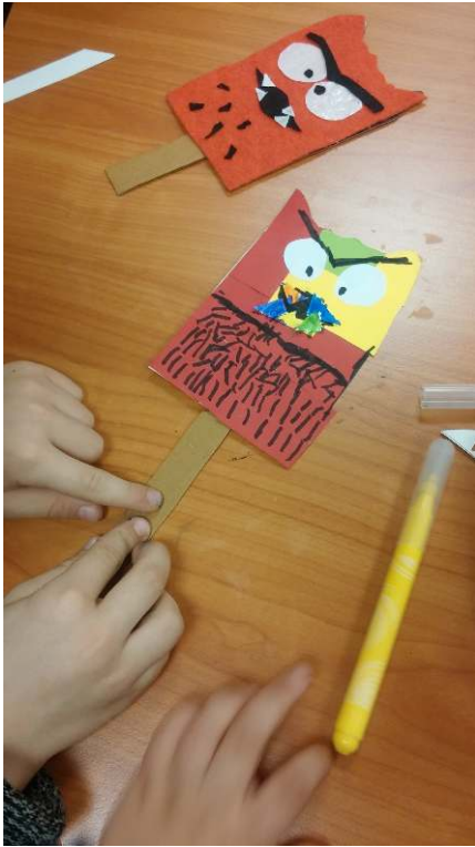
Activité 2 : Le masque des émotions