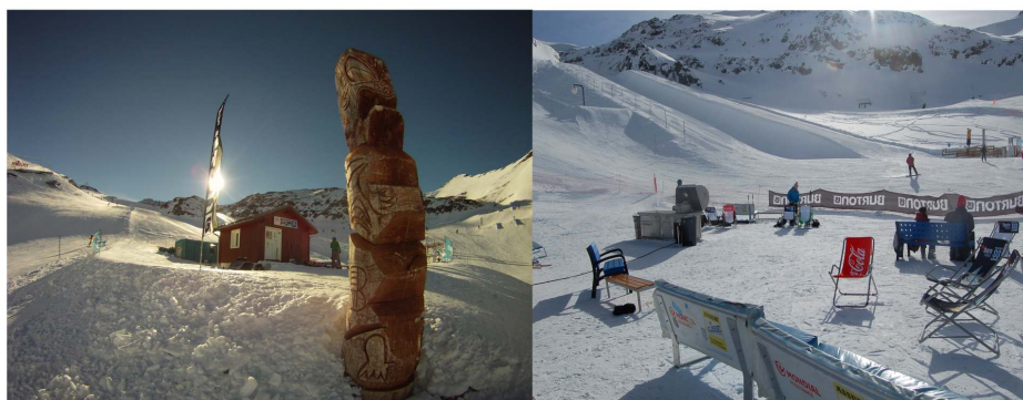
Illustration 4. Cabane des shapers - Cool Zone, Freestyle Land (2 Alpes) Chaises longues et barbecue à la Cool Zone.