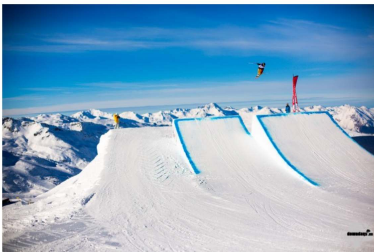
Illustration 1. Un pratiquant de freestyle , station des 2 Alpes.