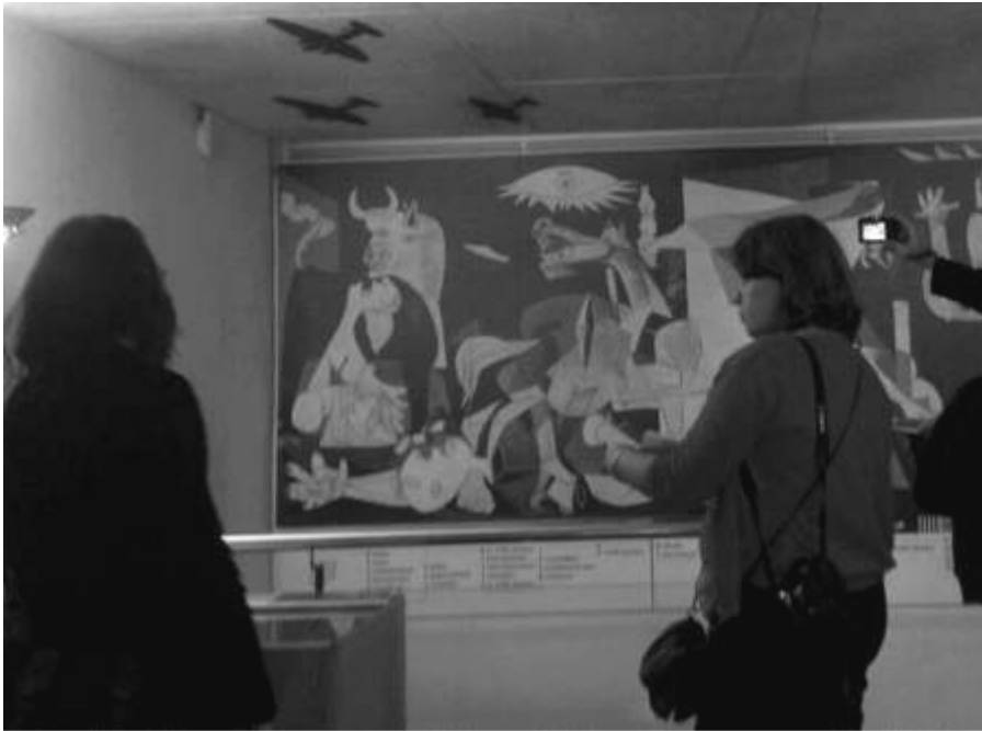
Copie de l'œuvre de Picasso au musée de la Paix de Guernica