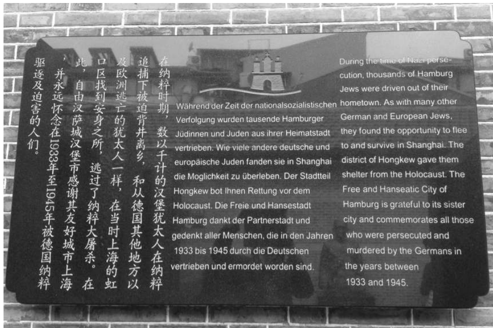
Illustration 5b. Photographie des deux nouvelles plaques