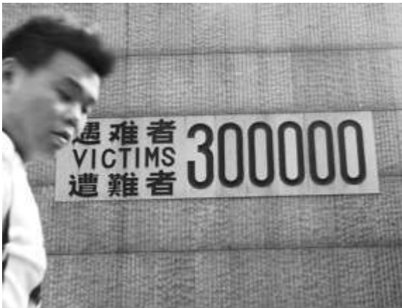
Illustration 1b. Abondance de la référence aux 300 000 sur le site