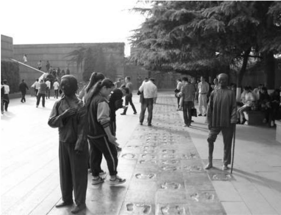
Mémorial du massacre de Nankin Cliché : auteure, novembre 2015