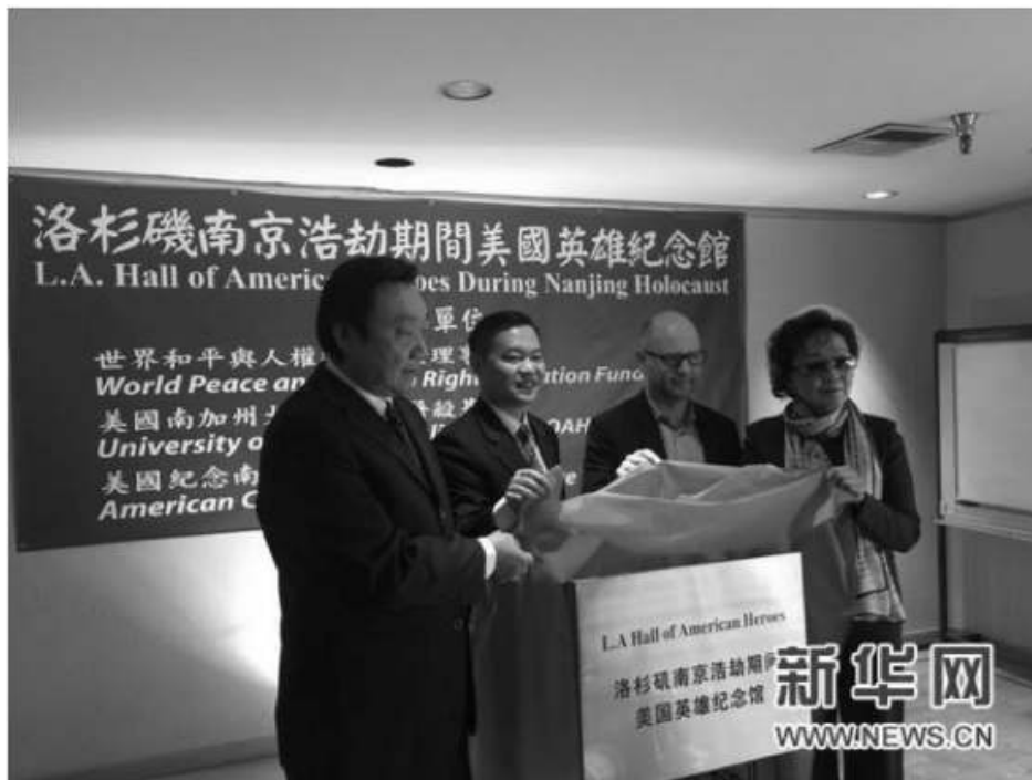
The inauguration of the L.A. Memorial Hall of American Heroes. The memorial hall is the first museum in the United States dedicated to the Nanjing Massacre.