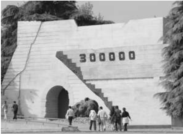
Mémorial du massacre de Nankin