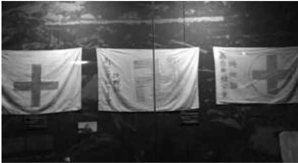
Illustration 1a. Croix gammée nazie entre deux Croix-Rouge

perpétré par les soldats nippons. Le massacre débute le 13 décembre 1937, dure six semaines et fait entre 200 000 et 300 000 victimes selon les sources.