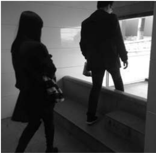
Mémorial du massacre de Nankin Salle des restes humains novembre 2016