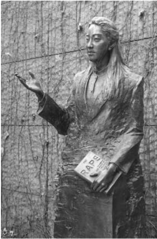
Mémorial du massacre de Nankin