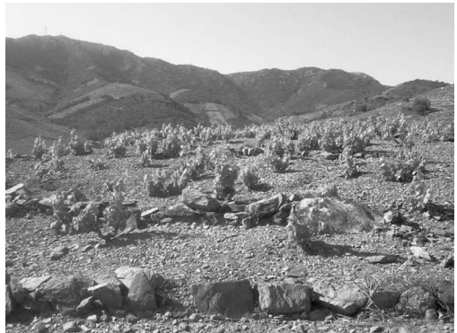
Quand la vigne pousse sur un sol quasi-lunaire... (Hauteurs de Collioure, P-O). Photo D. Michelin 24/05/2014

Terme ô combien approprié, la « conduite » d'une vigne s'étale sur de nombreuses années. Cruciale parmi les activités précitées, et visant à limiter la croissance naturellement galopante de la vigne, la taille est une opération viticole indispensable qui s'effectue idéalement après les plus fortes gelées, lors du repos végétatif. Elle se décline en une multitude de techniques particulières que recouvrent des termes extrêmement imagés : cordon de Royat, courgées du Jura, gobelet, guyot (simple, double, mixte), lépine, ou encore sylvoz.