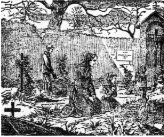
Fig. 2 – « Il giorno dei morti », dessin anonyme in G. Scavia, Libro per le giovinette delle scuole rurali , Turin, Vaccarino, 1871

ogni qualvolta rivedrà nella deserta stanzetta i vestitini della sua bambina, i suoi trastulli, i compiti di scuola, che formavano il suo orgoglio, quando li poteva mostrare alla mamma con una nota di merito della cara sua maestra 25 ?