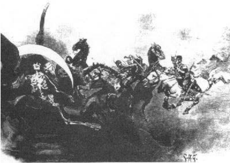
Fig. 6 – G. A. Sartorio, «L'esercito», in E. De Amicis, Cuore , Milan, Treves, 1892

Ces « racconti mensili » débouchent sur une leçon du père d'Enrico, expliquant à son fils en quoi consiste l'amour patriotique et quels sont les devoirs qu'il comporte. Une page dont la conclusion est la profession de foi que l'enfant doit savoir faire sienne s'il veut être sûr d'aimer l'Italie :