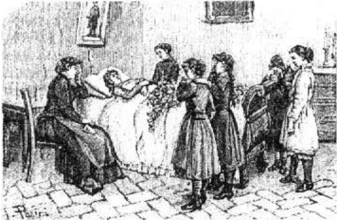
Fig. 4 – Panini, «La morte di Angiolina», in B. Rinaldi, La giovinetta italiana educata e istruita , Turin, Scioldo, 1890

Le référent permet aussi de comprendre comment le décès d'un camarade d'école peut être proposé aux élèves de l'école primaire comme sujet pour une composition d'italien :