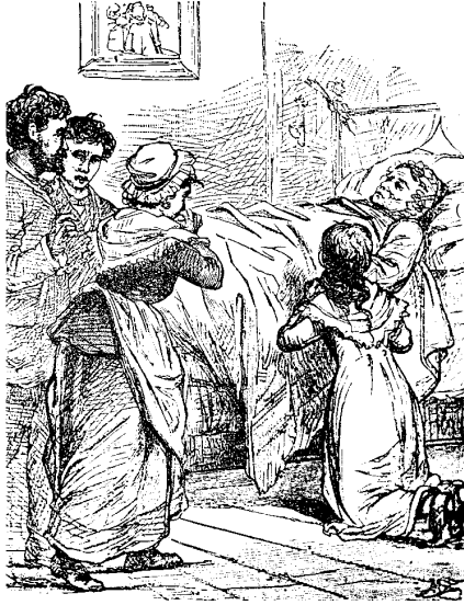
Fig. 3 – Dessin anonyme in L. Parravicini, Giannetto [1834], Livourne, Antonelli, 1852

Parravicini, un ouvrage qu'on peut considérer comme l'archétype italien du livre de lecture pour les écoles primaires. Gioconda, la mère du protagoniste Giannetto, est atteinte d'une maladie qui s'avère rapidement incurable. Pressentant sa fin proche, elle convoque ses enfants pour qu'ils écoutent attentivement ses derniers enseignements. Son testament moral, destiné à rester gravé dans leurs consciences, leur est dicté lors d'une scène dont les larmes sont absentes de part et d'autre :