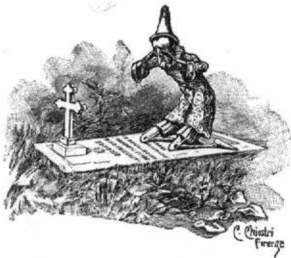
Fig. 1 – C. Chiostrì, « Pinocchio piange la morte della bella bambina dai capelli turchini », in C. Collodi, Le avventure di Pinocchio , 2 e éd., Florence, Bemporad, 1891

Une punition du même genre sanctionne au chapitre XXIII la désobéissance et la paresse de la marionnette, qui après de nouvelles péripéties est à nouveau « mortellement » punie, lorsque à la place de la Fée aux cheveux bleus, il trouve une tombe de marbre où est inscrite l'épithaphe suivante :