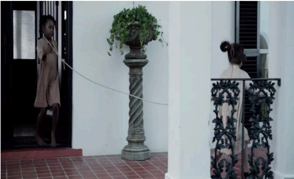
En haut, Les Négriers ; en bas, The Birth of a Nation