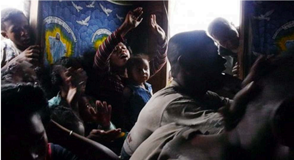
Au fond, la première épouse du possédé effectue un misalale « vers le haut » tandis qu'au premier plan sur la droite, des hommes effectuent les gestes misalale « vers le bas ».