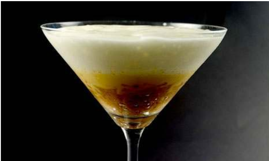
Déconstruction de l'omelette de pommes de terre