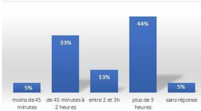
Figure 6 – Temps hebdomadaire moyen consacré aux ateliers autonomes dans les classes des enseignants enquêtés

comme des temps d'apprentissage et non pas uniquement comme des ateliers de délestage, ce que confirme l'utilisation quotidienne des ateliers dans 90 % des classes. Il reste que le temps moyen qui y est consacré chaque jour est assez hétérogène.