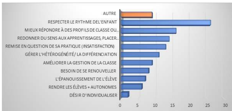
Figure 4 – Motivations des enseignants enquêtés pour la mise en place des ateliers autonomes