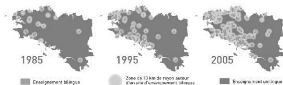
Fig.2 : Répartition de l'enseignement bilingue sur le territoire de la Bretagne. Communes disposant d'un site bilingue au minimum.