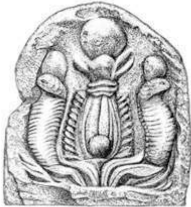
Fig. 6 Ostie, Museo Ostiense : antéfixe à décor égyptisant. Dessin M. Witek

certes dans un décor architectural, comme cette antéfixe d'Ostie (fig. 6), qui présente des traits complètement égyptiens, avec une fleur de lotus flanquée de cobras.