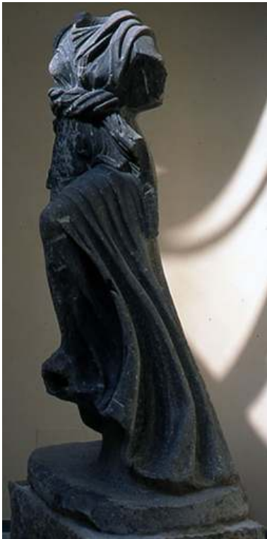
Fig. 4 Ostie, Museo Ostiense : statue d'Isis (?) trouvée à Portus.