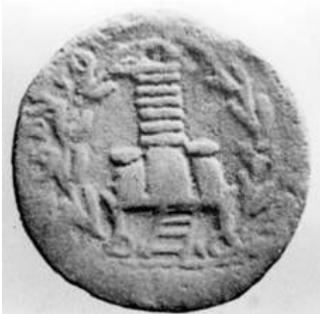
Fig. 3 Bostra, monnaie de l'époque de Dèce (249-251 ap. J.-C.).

Les pierres sont surmontées d'objets plats, en forme de galettes, que je serais tenté d'interpréter comme la représentation d'un rituel d'offrande. La légende de la monnaie établit en tout cas un lien avec la fête des Actia Dusaria 22 .