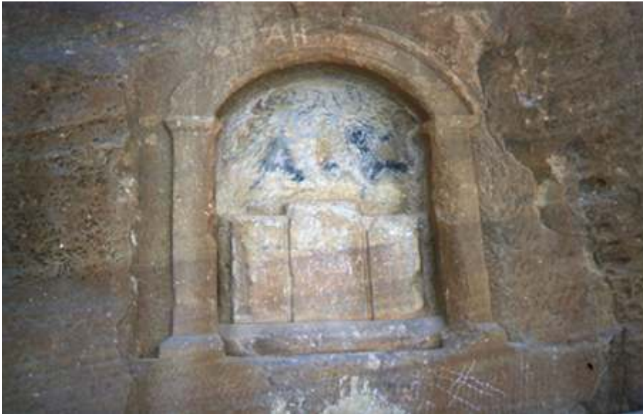
Fig. 2 Pétra : relief représentant trois bétyles dans le Sik.