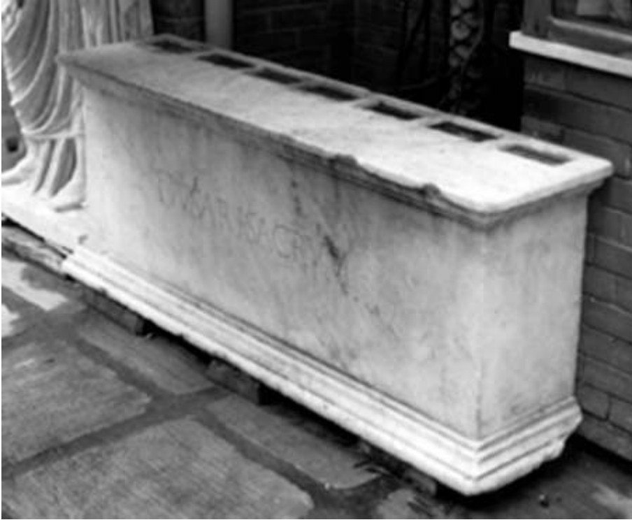
Fig. 1 Pozzuoli, Antiquarium : base ( motab ) venant du sanctuaire de Dousares.