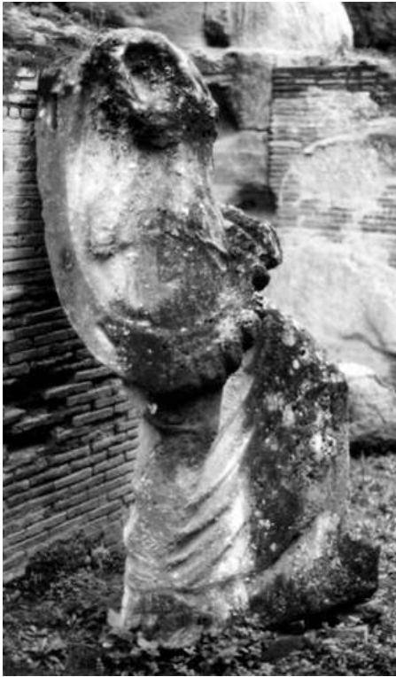
Fig. 5. Pozzuoli, Antiquarium : statue d'Isis (?).

Ici, le manteau forme un large bouffant depuis le dos jusqu'aux jambes et semble entraver le mouvement de ces dernières. Cette impression naît avant tout du traitement un peu cassant du vêtement, caractéristique de l'époque – cette œuvre datant des environs de 200 ap. J.-C. Ici aussi, l'absence des parties dévêtues du corps et de l'objet autrefois ajouté sous le pied gauche a handicapé, jusqu'à il y a peu, l'attribution de la statue.