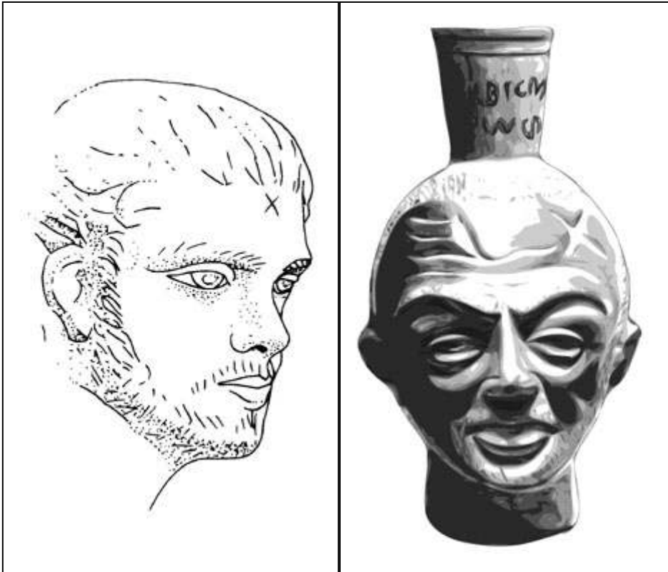
Abb. 1 Ludovisi-Sarkophag (3. Jh.)