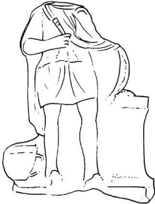
Abb. 7 Dieburg, CIMRM 2, Nr. 1249

Kann man noch weiter gehen? Wie wir gesehen haben, behauptet Tertullian, sowohl im Isis-, als auch im Mithraskult fände die Initiation per lauacrum statt. 89 Muss man, wie Vermaseren 90 , daraus ableiten, dass die Mithras-Anhänger durch Besprengung getauft wurden? Das hieße, den Apologeten in die Falle zu gehen, die nur allzu schnell bereit sind, den Vergleich (oder aber die Abgrenzung) zwischen Christentum und Heidentum überzustrapazieren. Aller Wahrscheinlichkeit nach ist das lauacrum , das Tertullian in De baptismo den Mithras-Mysterien zuschreibt, seiner Ansicht nach nichts weiter als die signatio in fontibus des De praescr. Der von Tertullian verwendete Plural drückt entweder einen allgemeinen Tatbestand aus (ebenso viele »Quellen« wie speleae ) oder einen spezifischen Sachverhalt (mehrere »Quellen« pro spaeleum , wie ein Auszug von Eubulos nahelegt). 91