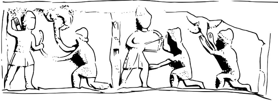
Abb. 6 Besigheim, CIMRM 2, Nr. 1301