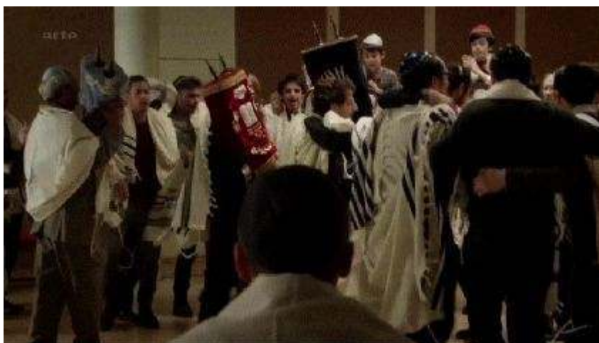
Fig. 5. Sim'hat Torah (2.3)