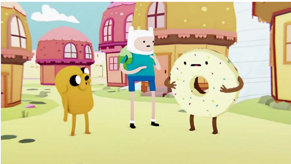
Figure 6 : Adventure Time , S05E15, « A Glitch is a Glitch »