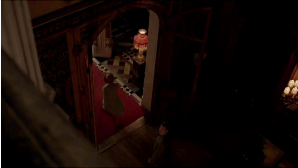
Figure 8 : Thomas scrutant le départ de Sarah Bunting