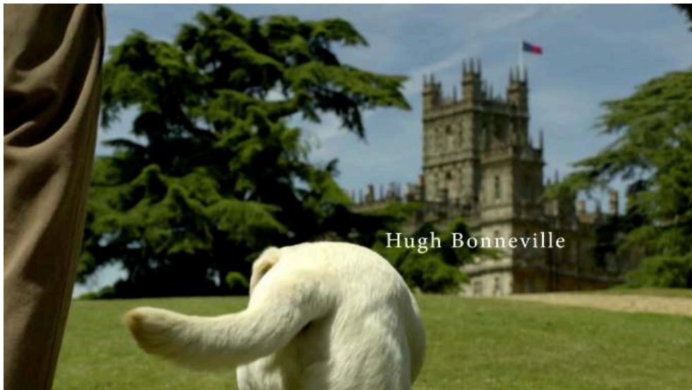
Fig. 1 & 2 : première image du générique ; l'escalier des serviteurs dans le générique