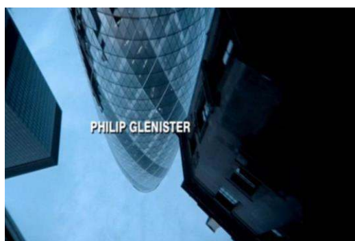
Fig. 4 : Ashes to Ashes , générique d'ouverture du pilote.

Simultanément, une voix-off non identifiée, aux accents enfantins, lit le dossier psychologique du policier, faisant le récit de ses délires, reprenant à l'identique le leitmotiv du personnage, répété en ouverture de chaque épisode de Life on Mars , refrain bien connu du téléspectateur : « My name is Sam Tyler. I had an accident and I woke up in 1973. Am I mad, in a coma or back in time? Whatever had happened, it was like I'd landed on a different planet. If I could figure out why I was here, then maybe I could get back home. » Ashes to Ashes s'inscrit ici dans la continuité et dans la rupture. Alex Drake, profilleuse pour la Metropolitan Police, n'est autre que la psychologue brièvement et anonymement évoquée par Sam dans le dernier épisode de Life on Mars . Dans toute cette séquence d'ouverture, la ville de Londres est filmée en contre-plongée, telle une image en miroir offrant une symétrie inversée comme un reflet et produisant déjà un sentiment de défamiliarisation, alors même qu'il s'agit encore du réel (voir figure-4).