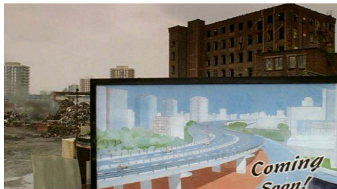
Fig. 1: Manchester en 1973

rassurant et, croit-il, maîtrisé : son commissariat. L'officier qui le découvre désorienté ne lui demande-t-il pas : « Didn't you read the sign? », la polysémie de « sign » (panneau/signe) annonçant la valeur programmatique de la séquence. Il s'agit pour le héros, et le spectateur avec lui, d'apprendre à interpréter les signes afin de (re)construire le sens de la vie/ville. Les grands ensembles de Satchmore Road en arrière-plan sont ceux-là mêmes où Sam menait son enquête en 2006 ; le terrain vague où il gît n'est autre que le chantier de destruction des anciennes manufactures textiles qui firent les beaux jours de la ville pendant la révolution industrielle : à présent à l'abandon, elles vont céder leur place à l'autoroute suspendue, dont l'érection prochaine est annoncée par un panneau publicitaire, «Coming Soon : Manchester Highway in the Sky » (voir figure 1).