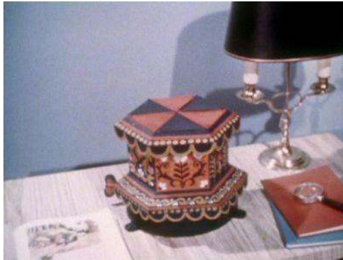
Fig. 9 : La version originale du générique d'ouverture de Camberwick Green .