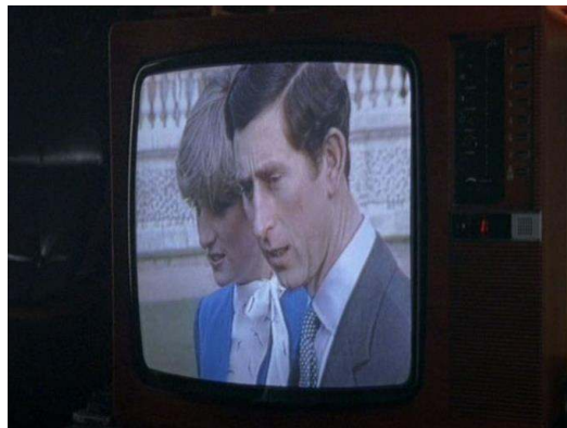
Fig. 6 : La télévision regarde la télévision ( Ashes to Ashes , saison 1, épisode 2).

promoteurs, leur pub traditionnel doit être détruit pour laisser place à un immeuble de bureaux ou d'habitations bourgeoises. Le mariage retransmis à la télévision est un spectacle, une fiction nationale qui dissimule mal ses artifices : il est cantonné au cadre de l'écran du téléviseur (voir figure 6).