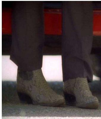
Fig. 12: Gene Hunt : cowboy des temps modernes...

celle des héros représentés sur les affiches de films qui décorent les murs de son bureau.