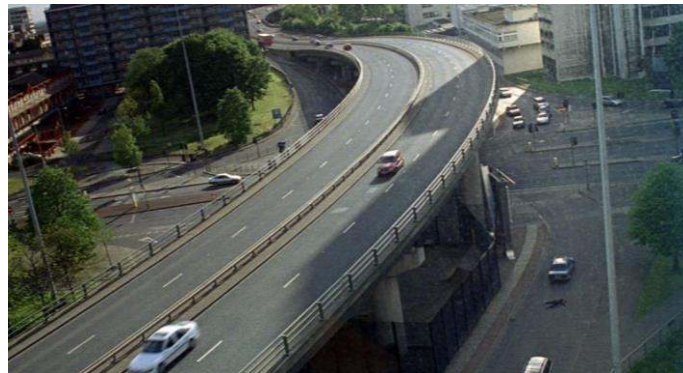
Fig. 2: Manchester en 2006