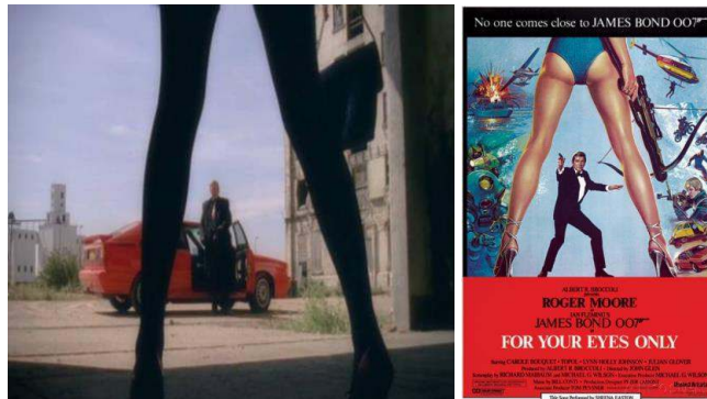
Fig. 13 ... ou nouvelle incarnation de l'éternel masculin britannique 21 ?

Il le constate lui-même : « My reputation precedes me » ; son personnage est préconstruit grâce à la première série. Gene Hunt est le héros autodéterminé d'un western urbain : son identité, on l'apprend