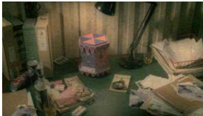
Fig. 10 : La version adulte et policière de Camberwick Green dans Life on Mars .

Le pré-générique de cet épisode de Life on Mars reprend les codes visuels et narratifs établis par l'émission pour enfants : la voix off du narrateur emprunte les mêmes intonations et reproduit, à quelques détails près, la même formule rituelle. Pour autant, la marionnette est celle de Sam, reconnaissable à sa veste en cuir et à son pantalon à pattes d'éléphant (voir figure 11) :