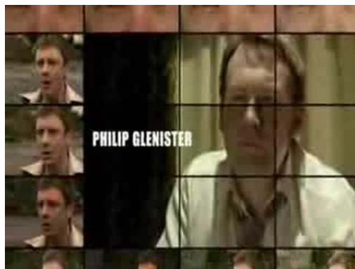
Fig. 7: générique d'ouverture de Life on Mars .

La télévision, comme motif ou métaphore, devient un outil herméneutique pour le héros désorienté. Le générique d'ouverture de Life on Mars , qui n'apparaît pas dans l'épisode pilote, souligne d'emblée l'importance donnée aux écrans dans les deux séries (voir figure 7).