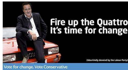
Fig. 17: Affiche du Parti Conservateur (2010)

Décidément, le DCI du commissariat de Fenchurch mène à présent une existence indépendante des séries qui l'ont mis en scène.