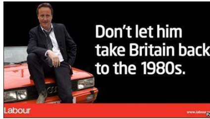
Fig. 16 : Affiche du Parti Travailleiste (2010)