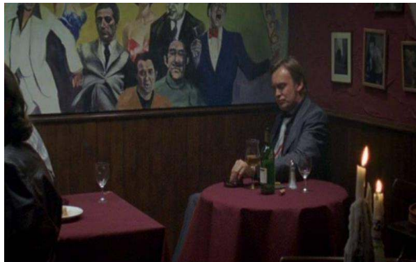
Fig. 14 : Gene Hunt : nouvelle figure d'un patrimoine populaire ?

dans la conclusion de Ashes to Ashes , est une construction qui reprend des « morceaux » du patrimoine populaire, identité factice, fantasmée, élaborée par un jeune policier tué avant que d'avoir fait carrière. L'hybridité du personnage est primordiale et explique le patchwork référentiel qui définit les séries : Sam et Alex n'évoluent pas dans leur propre esprit mais dans celui de Gene, archange psychopompe qui accompagne les policiers dans l'acceptation de leur mort. Outre les échos aux chansons, films et émissions de télévision qui caractérisent la rhétorique des deux séries, ces dernières mettent en place un jeu de rimes internes qui permettent l'élaboration d'un nouveau mythe qui leur est propre. Gene Hunt en est le point d'orgue. Son vocabulaire fleuri émaille les épisodes et caractérise le personnage, le rendant unique et reconnaissable: « bollyknickers », « fire up the quattro », « kicking a nonce ». Gene Hunt finit par appartenir au patrimoine populaire, notamment lorsqu'il est filmé en plan fixe, assis devant le « wall of fame » de la pizzeria où l'équipe a ses habitudes 22 (voir figure 14).