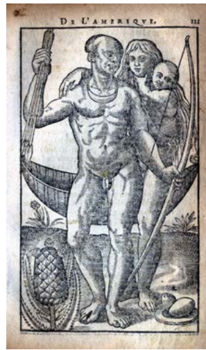
Famille Tupinamba à l'ananas (Jean de Léry, Histoire d'un voyage fait en la terre du Bresil , Genève, Jean Vignon, 1611, p. 121).