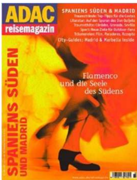
Portada de la revista de viajes del ADAC, "Spaniens Süden und Madrid" (El sur de España y Madrid), 2004