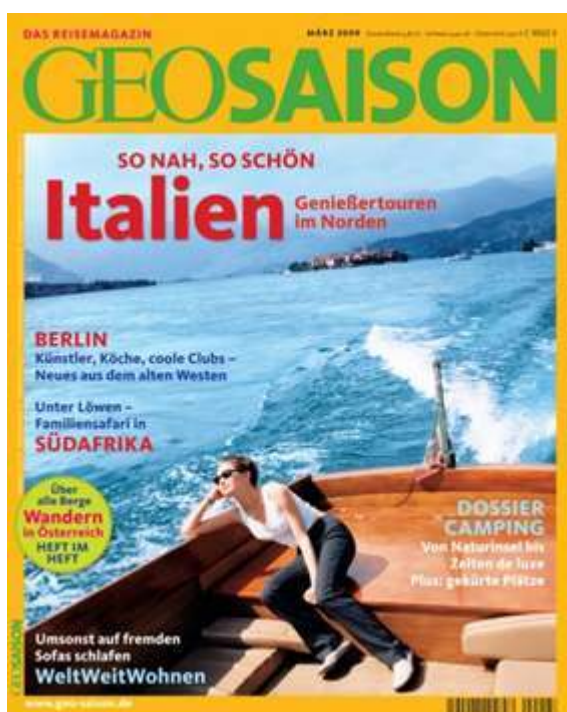
Portada de la revista GEO SAISON, marzo de 2009