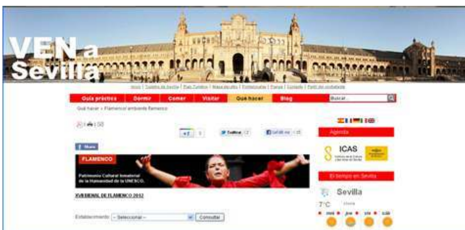
www.visitasevilla.es [consultado 25/01/12]