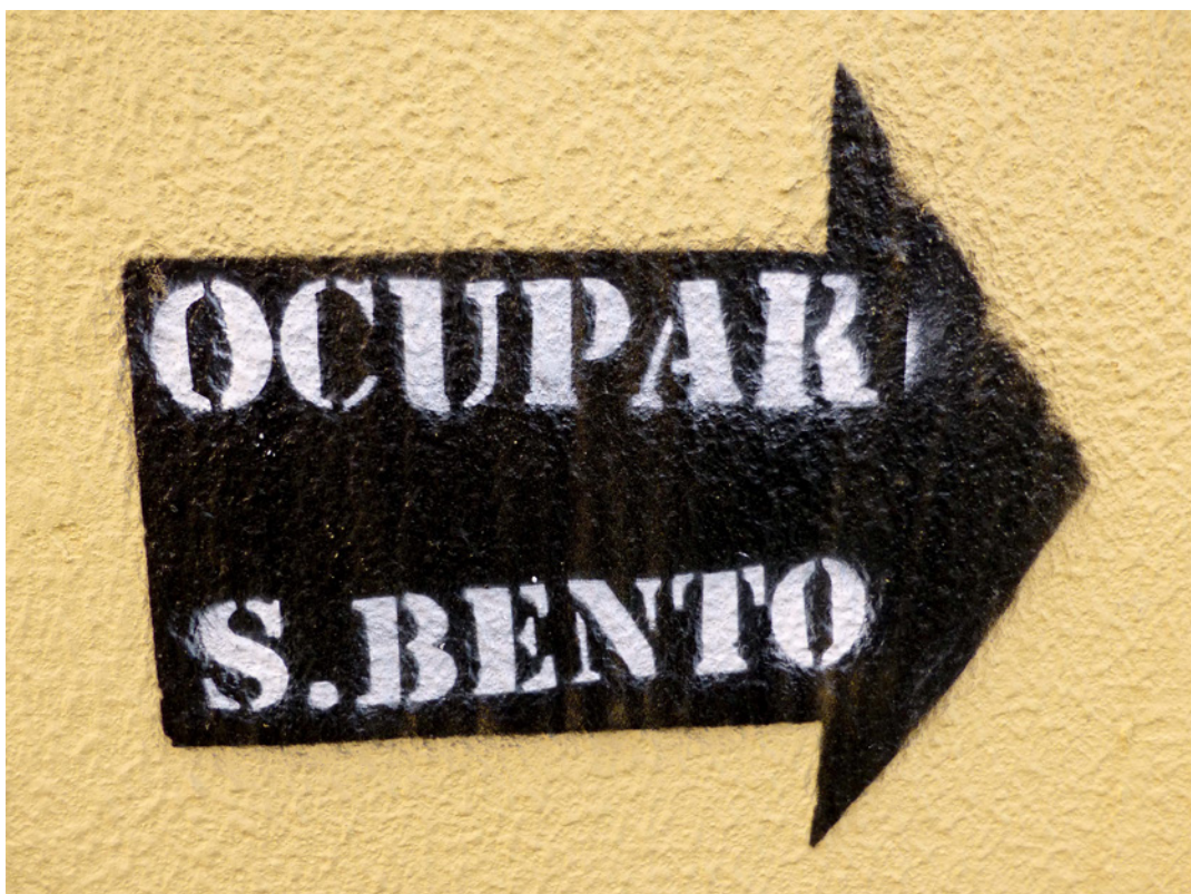
Imagem 4. Grafiti no Bairro Alto, Lisboa, 2013.