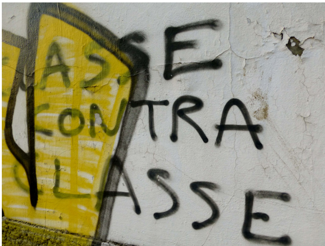
Imagem 3. Grafiti em Lisboa 2013.

precisamente a dinâmica de inter-relação entre dimensões sociais 31 , problematiza a relação entre discurso e práticas subjacentes a um “teatro revolucionário”. Afirmava este autor, nos anos 70, que o “teatro de vanguarda” e/ ou “revolucionário” não se pode confundir com um teatro de “elites” ou “burguês”, na medida em que um “teatro revolucionário” deve manter um cariz “popular”. Nas suas palavras, é sua função “pelos meios próprios ao teatro, ajudar a fazer a revolução proletária e permitir que ele se desenvolva” (1972:16), ou seja, para ser “de vanguarda”, o “teatro revolucionário” devia ser “popular”.