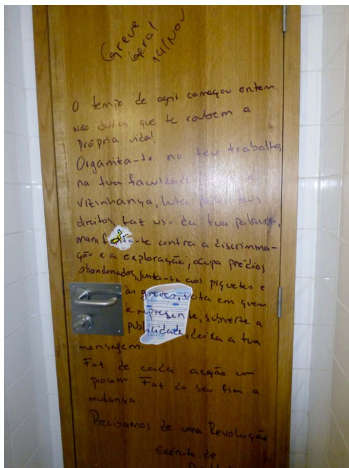
Imagem1. Intervenção na porta da casa de banho feminina. ISCTE-IUL, 2013.

art from a glocal perspective” (2012), nesta mesma revista 6 , em sociologia política era publicado um artigo denominado “Cycles in Politics: Wavelet Analysis of Political Time Series” 7 , onde se reafirmava esta ideia.