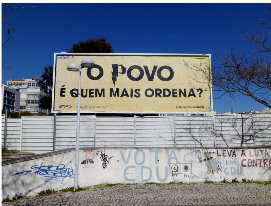
Imagem 2. Graffiti na estação de Comboios de Entrecampos, Lisboa, Março 2013.

Apesar desse potencial, não é certo que toda a ação ativista tenha uma efetiva capacidade mobilizadora da transformação social e política. Daniel Hamiche num livro escrito precisamente no período dos anos 70, denominado Le Théâtre et la Révolution (1972), onde corrobora