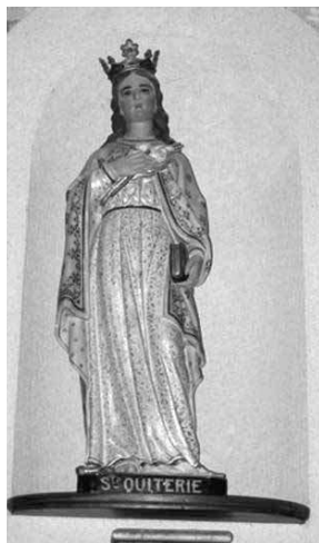
1. Santa Quitéria . Aire-sur-l'Adour (França).