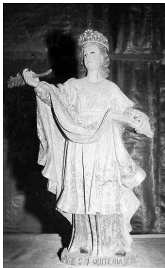
6. Santa Quitéria. Felgueiras, Santuário de Santa Quitéria.