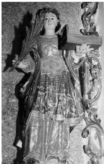
8. A criada Cita. Felgueiras, Santuário de Santa Quitéria.

Assim, tomando como elementos de referência a gravura do Colégio de São Lourenço (Fig. 4) e o belíssimo conjunto escultórico do Santuário de Felgueiras, onde são representadas as nove irmãs (Fig. 5), juntamente com o Arcebispo e Cita, passaremos a descrever, de forma sucinta, cada uma das figuras fazendo uma referência particular aos respectivos atributos.