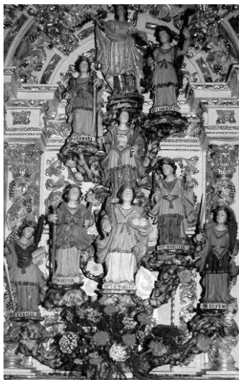
5. Santa Quitéria e suas oito irmãs. Felgueiras, Santuário de Santa Quitéria.

Maior do Porto, bem como o que ornamenta o pequeno retábulo da capela do lado da Epístola, no Santuário de Santa Quitéria, em Felgueiras (Fig. 5), ao qual faremos referência de forma mais detalhada.