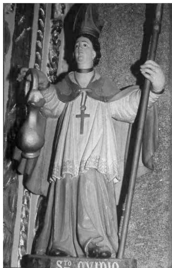
7. Santo Ovídio, Arcebispo de Braga. Felgueiras, Santuário de Santa Quitéria.