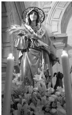
2. Santa Quitéria . Sorihuela del Guadalimar (Espanha).