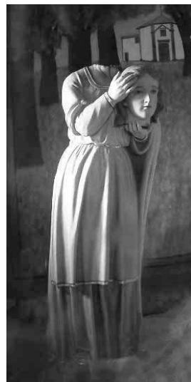
10. Santa Quitéria martirizada segura a cabeça. Felgueiras, Capela 8 do Santuário de Santa Quitéria.

como podemos ver numa imagem pertencente ao arquivo do Santuário de Santa Quitéria, de Felgueiras, representação esta que se verifica, igualmente, no conjunto escultórico da última capela do percurso que os peregrinos realizam no mesmo Santuário e na qual se regista o oitavo passo da vida de Santa Quitéria ( Fig. 10 ).