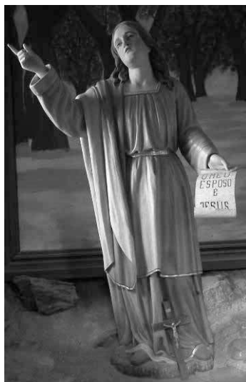
9. Santa Quitéria com o pergaminho. Felgueiras, Capela 6 do Santuário de Santa Quitéria.

Esta tomada de posição valeu-lhe, como sabemos, o martírio. Por isso, o Sétimo Passo, identificado pela legenda: «S. a Quitéria prestes a ser degolada por Germano, seu pretendente», ilustra o seu martírio, por degolação. Tendo como pano de fundo uma floresta na qual se agita o cavalo branco de Germano, como se tivesse consciência da tragédia que estava para acontecer, a jovem Quitéria, ajoelhada no chão e de mãos postas, ergue os olhos ao alto, em oração. O facto de se encontrar representada nesta atitude orante ilustra o que acima foi referido quando apresentámos a lenda mais conhecida em Espanha. Confiante na glória que a aguarda junto de Deus, não oferece qualquer resistência e entrega a sua vida na fidelidade ao seu Senhor. Germano, vestido como soldado romano, agitado e de olhos crispados postos na jovem, ergue bem ao alto a espada com a qual desferrará o golpe fatal.