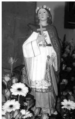
3. Santa Quitéria . Paróquia de Boaventura, Funchal.

Palma de Maiorca e Alcázar de San Juan, bem como em Sorihuela del Guadalimar (Jaén) que tem Santa Quitéria como co-padroeira e da qual apresentamos uma imagem ( Fig. 2 ).