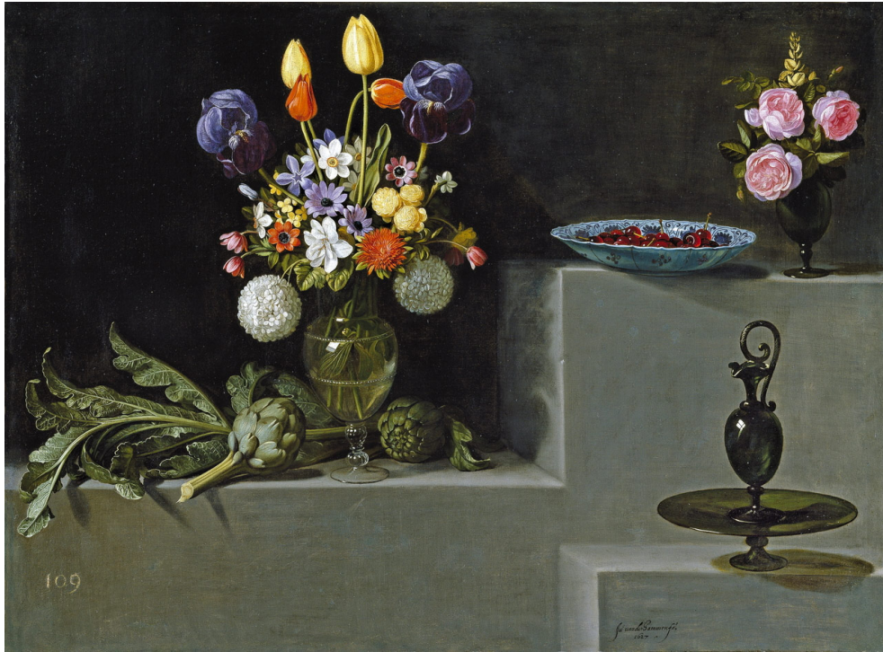
Fig. 1: Juan Van der Hamen, Bodegón con alcachofas, flores y recipientes de vidrio , 1627, óleo sobre lienzo, 81 × 110 mm., Madrid, Museo Nacional del Prado (P7907)

importante de retratos suyos, y fue uno de los primeros autores españoles de paisajes independientes 5 . Su obra es uno de los mejores ejemplos de los importantísimos cambios en los géneros pictóricos que se estaban produciendo en España a caballo de los siglos XVI y XVII, y de cómo esos cambios reflejan a su vez transformaciones importantes desde el punto de vista social y cultural.