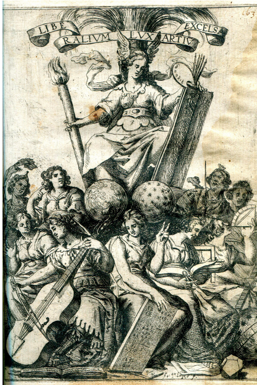
Fig. 4: Francisco López, La pintura como reina de las artes liberales , Cobre, talla dulce, 176 x 127 mm. En Vicente Carducho, Diálogos de la pintura. Su defensa, origen, esencia, definición, modos y diferencias , Madrid, Francisco Martínez, 1633, fol. 163 r.