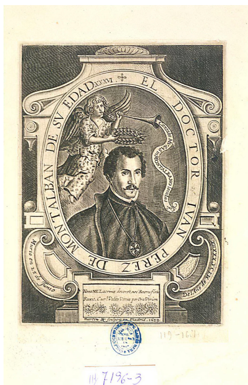
Fig. 5: Martin Droeswoode, Juan Pérez de Montalbán , 1638, cobre, talla dulce, 170 x 122 mm. En Pedro Grande de Tena, Lágrimas panegíricas a la tenprana muerte del gran poeta, i teólogo insigne doctor Iuan Pérez de Montalbán , Madrid, Imprenta Real, 1639, prelims.

del retrato. A su vez, el cuidado que puso en sus propias imágenes nos recuerda el papel importante que este género desempeñó en las políticas de autopromoción entre los escritores cortesanos de las primeras décadas del siglo XVII 49 .