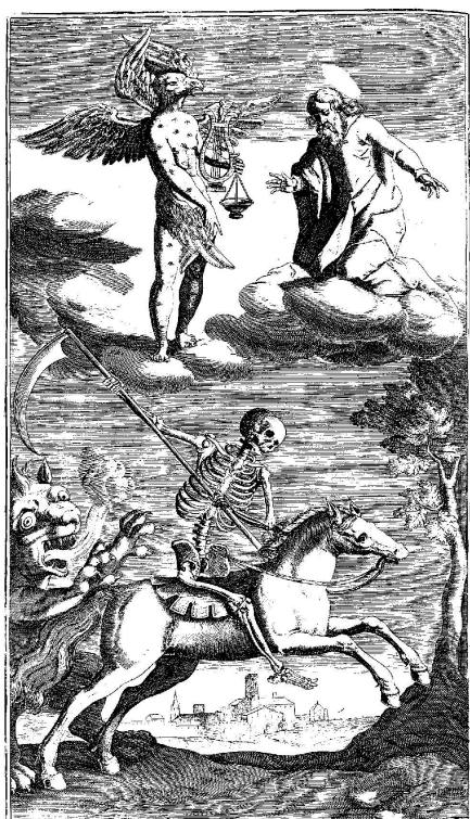
Fig 9: Grabado del Apocalipsis sobre un dibujo Juan de Jáuregui en Luis del Alcázar, Vestigatio arcani sensus in Apocalypsi: cum opusculo De sacris ponderibus ac mensuris , Antverpiae: Apud Ioannem Keerbegium, Liber III, cap. VI, vers. 8, p. 456.

Apocalipsis 56 . Pero también utilizó el tema artístico para la reflexión de carácter moral sobre el comportamiento humano en el poema que lleva por título “A las estatuas de dos hermanos de Sicilia, que libraron a sus padres del mayor incendio del Etna. Imítase a Claudiano, en lo último de sus obras” 57 . En realidad, se trata de una imitación del epigrama “ Aspice sudantes venerando pondere fratres ” de Claudiano ( Carmina Minora 17), donde el poeta latino describía un conjunto escultórico en el que dos hermanos libraron a sus padres de morir tras un incendio provocado por una erupción del Etna. El epigrama ofrece una descripción detallada del conjunto escultórico.