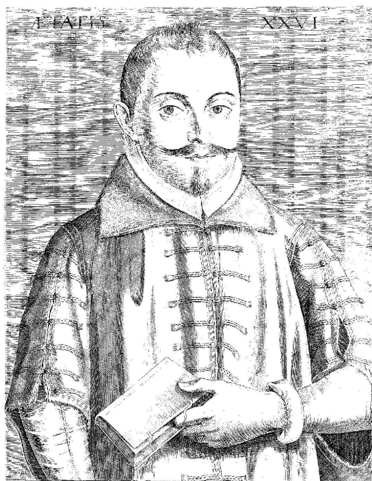
Fig. 4: Retrato de Lorenzo Ramírez de Prado dibujado por Juan de Jáuregui, en Pentecontarchos sive Quinquaginta Militum Ductorem, Antverpiae: Apud Ioannem Keerbegium , 1612, p. 10.

la pintura y, más concretamente, del dibujo, el poeta trata algunos motivos esenciales del ars pictorica como la perdurabilidad de la imagen, la luminosidad de la obra, la animación de la efigie (que parece cobrar vida) y la nombradía que merced a la misma pueden adquirir tanto el retratado como el artista.