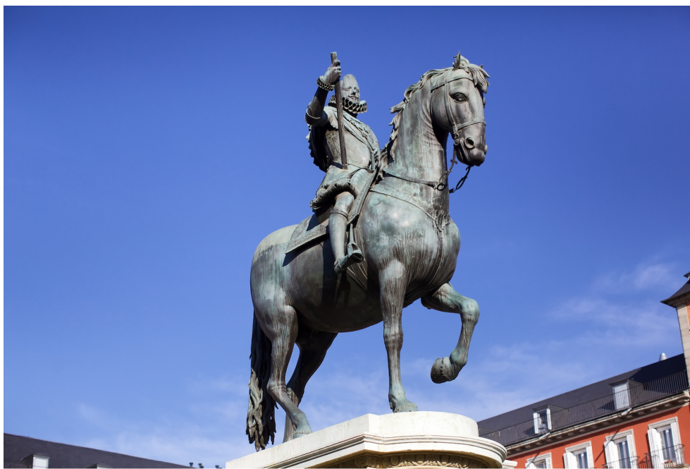
Fig. 8: Estatua de Felipe III comenzada por Juan de Bolonia y terminada por Pietro Tacca en 1616, ubicada en la Plaza Mayor de Madrid.