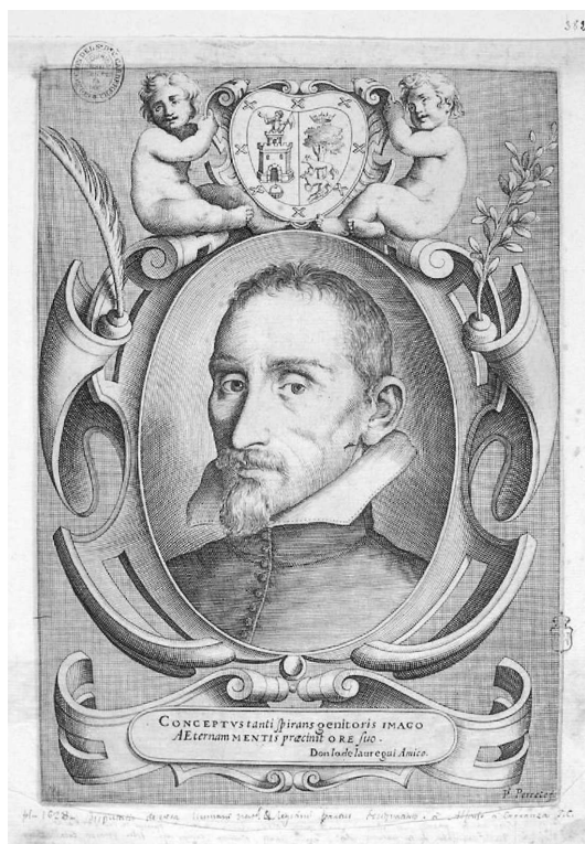
Fig. 1: Retrato de Alfonso de Carranza dibujado por Juan de Jáuregui y grabado por Pedro Perret, incluido en el libro Disputatio de Vera Humani Partus Naturalis , Madrid: Francisco Martínez, 1628, p. 9.

valorarlas debidamente hoy. Así, por ejemplo, aparte de la falsa atribución a Jáuregui del célebre retrato de Cervantes que se exhibe en la Real Academia Española 31 , nunca se ha localizado e identificado una Judith (a la que aludieron, entre otros, Lope de Vega y Vera y Mendoza 32 ), ni las pinturas que supuestamente dedicó al duque de Medina de las Torres (según refería Carducho 33 ), ni el rostro del Salvador (mencionado por el doctor Salinas y Castro) 34 . Pero conservamos otros retratos de su mano.