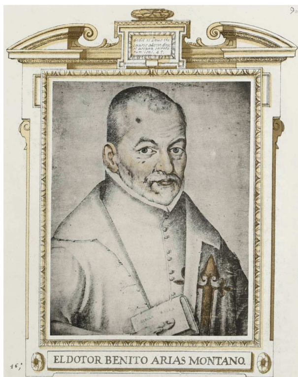
Fig. 7: Retrato de Benito Arias Montano por Francisco Pacheco, Libro de descripción de verdaderos retratos , Sevilla, 1599, fol. 90r r o a