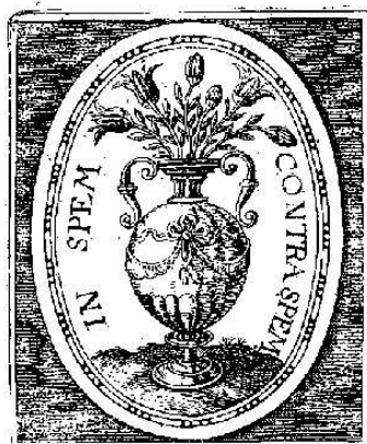
Fig. 5: Cuarteto de Juan de Jáuregui dedicado a Lorenzo Ramírez de Prado, en Pentecontarchos sive Quinquaginta Militum Ductorem, Antverpiae: Apud Ioannem Keerbegium, 1612 , p. 9.