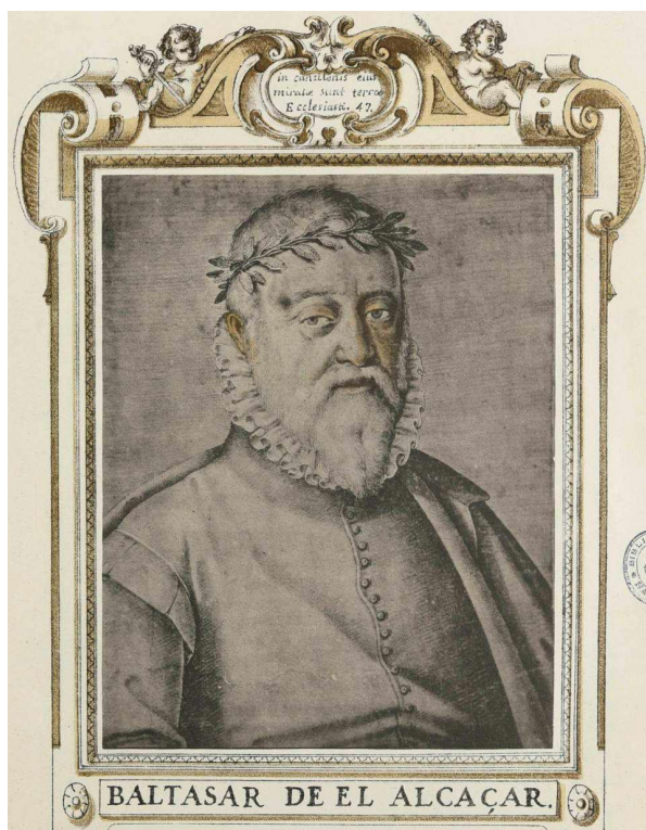
Fig. 6: Retrato de Baltasar del Alcázar por Francisco Pacheco, Libro de descripción de verdaderos retratos , Sevilla, 1599, fol. 68 ra .