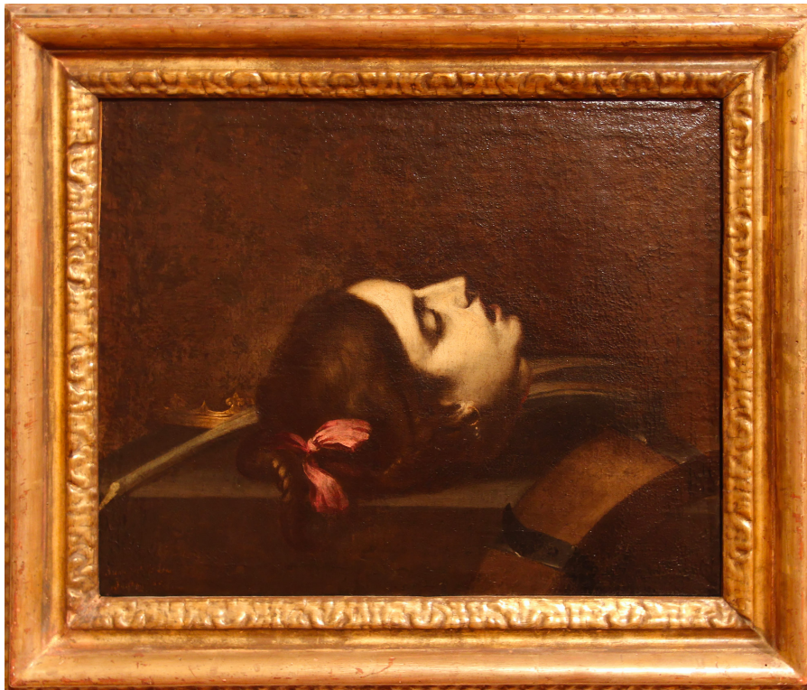
Fig. 13: Sebastián de Llanos y Valdés, Cabeza de santa Catalina , ca. 1660-1670, 53,7x66,3 cm, óleo sobre lienzo, Castres, Musée Goya.