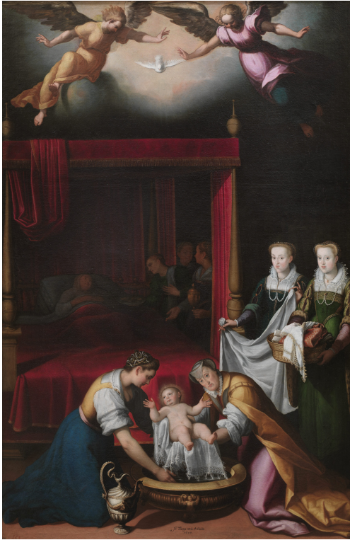
Fig. 7: Juan Pantoja de la Cruz, Nacimiento de la Virgen , 1603, óleo sobre lienzo, 270x172 cm, Madrid, Museo Nacional del Prado.