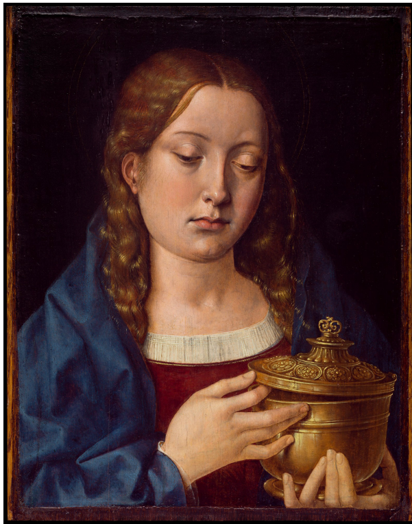
Fig. 6: Michel Sittow, Catalina de Aragón como santa María Magdalena , ca. 1500, óleo sobre tabla, 30,7x24 cm, Detroit, Detroit Institute of Arts.