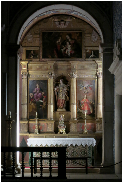
Fig. 8: Josefa de Óbidos, Retablo de santa Catalina , 1661, Óbidos, iglesia Santa Maria