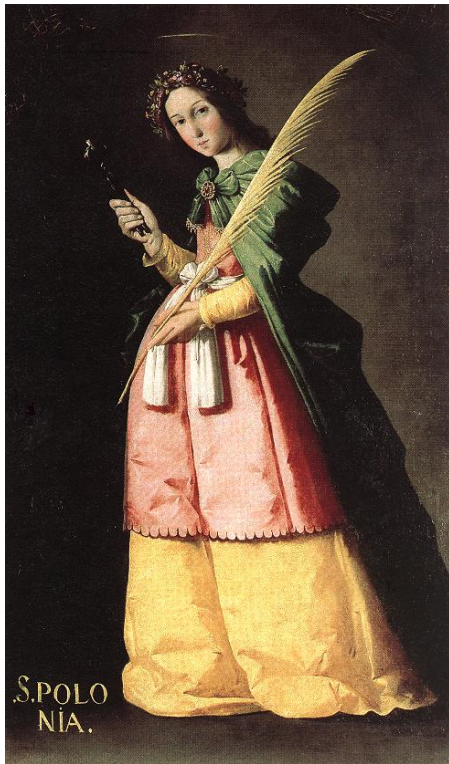
Fig. 1: Francisco de Zurbarán, Santa Apolonia , ca. 1636, óleo sobre lienzo, 134x67 cm, Paris, Musée du Louvre