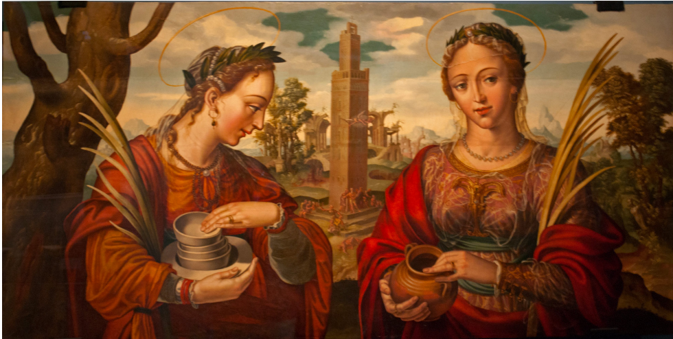
Fig. 2: Hernando de Esturmio, Santa Justa y santa Rufina , 1555, óleo sobre tabla, 79x162 cm, Sevilla, Catedral, Capilla de los Evangelistas.