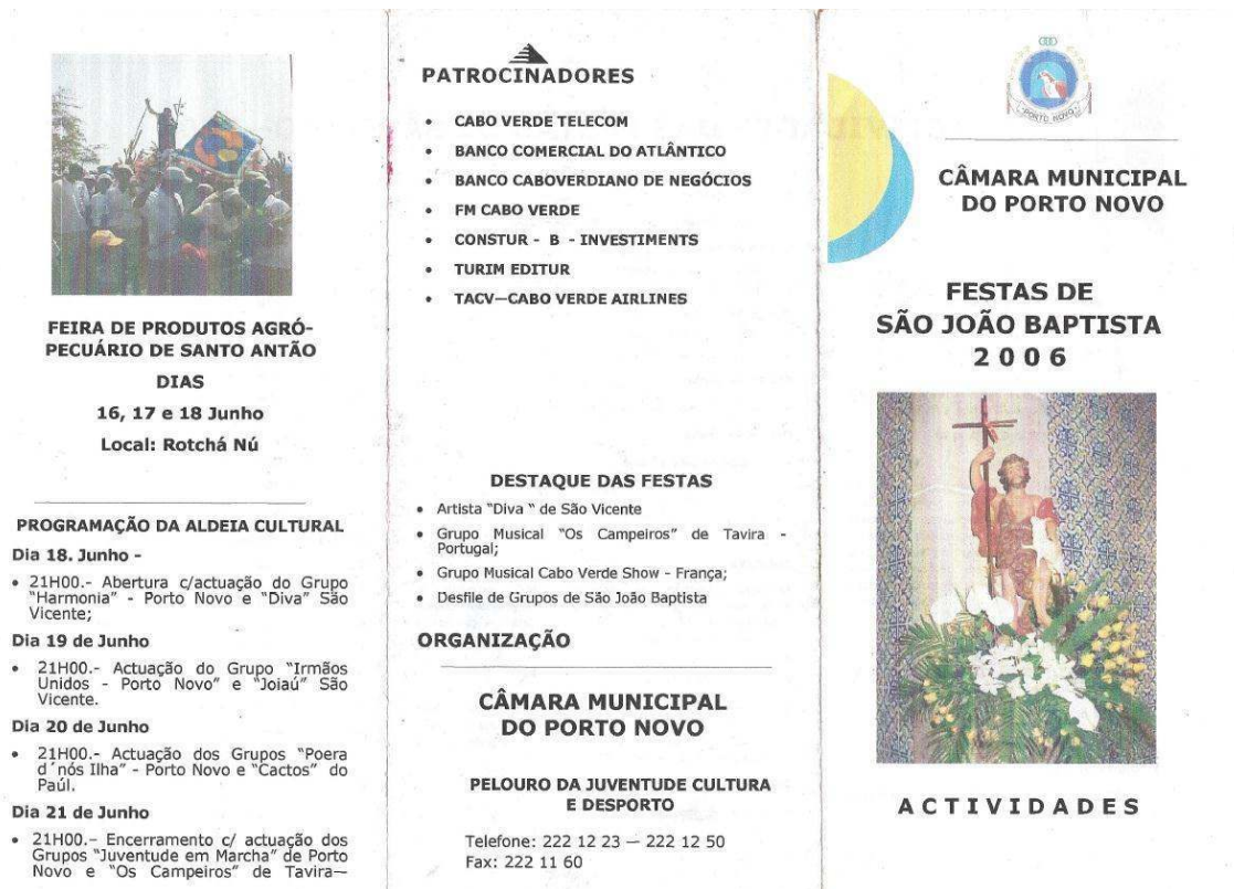
FIGURA 1 – Desdobrável com o programa de divulgação das Festas de São João, em Porto Novo, Santo Antão, 2006

que acontece numa praça da cidade, os grupos de koladeiras 6 dançam ao som dos tamboreiros (tocadores de tambor). As koladeiras destacam-se dos outros participantes no evento pelo vestuário, e porque a forma exuberante e intensa como dançam inibe os outros participantes de se juntarem à performance ativa.