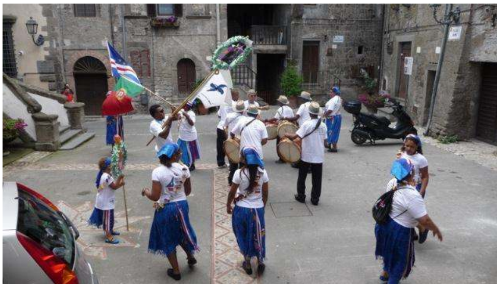
IMAGEM 1 – Grupo de Kola San Jon na praça em frente ao Palácio Orsini, Bomarzo, Itália