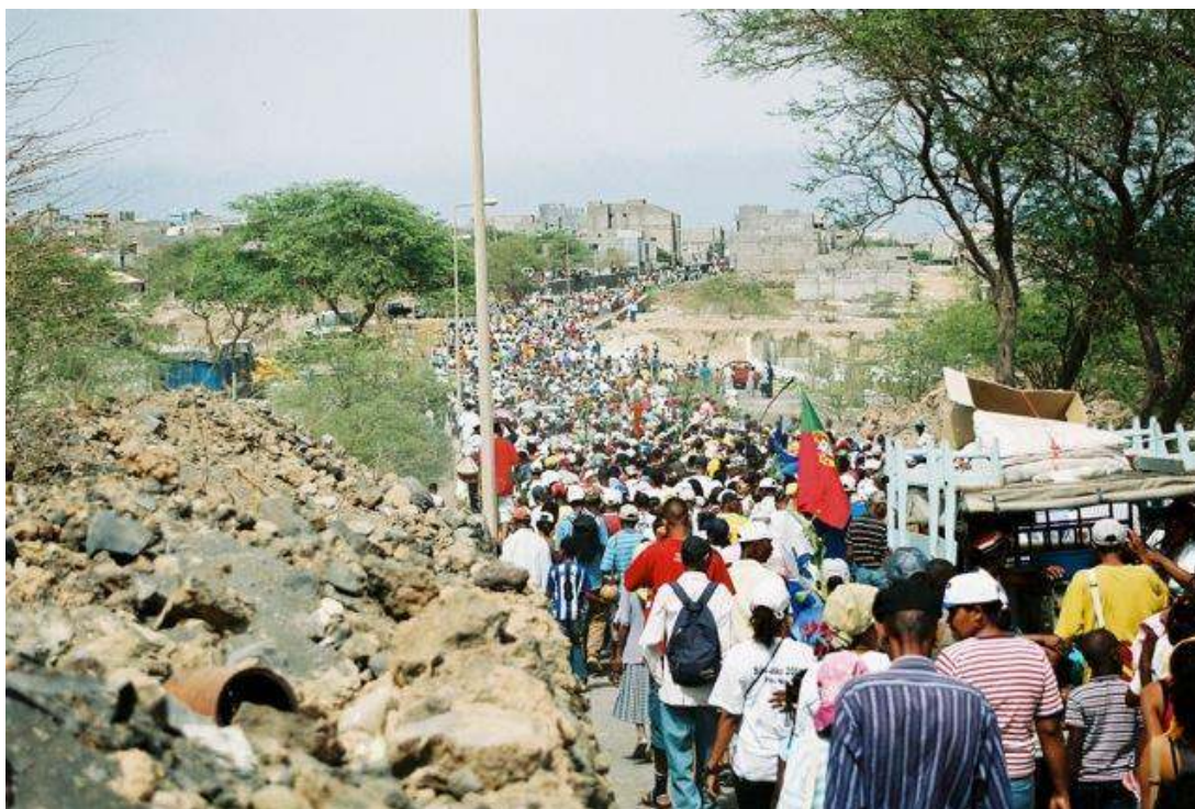
IMAGEM 2 - ENTRADA DA PEREGRINAÇÃO DA FESTA DE SÃO JOÃO EM PORTO NOVO

A peregrinação tem início por volta das 8 horas da manhã. Centenas de pessoas participam nesta jornada na qual os tamboreiros tocam e as pessoas dançam, rodeando a imagem do santo que é transportada num andor e adornada com rosários e com flores. A jornada tem paragens obrigatórias durante as quais se partilha comida e bebida. Depois de cerca de 22 km, o cortejo para à entrada da localidade de Porto Novo, acolhendo as pessoas que o esperam. O grupo de peregrinos, agora reforçado, prepara então a entrada na cidade conferindo-lhe um perfil quase triunfal.