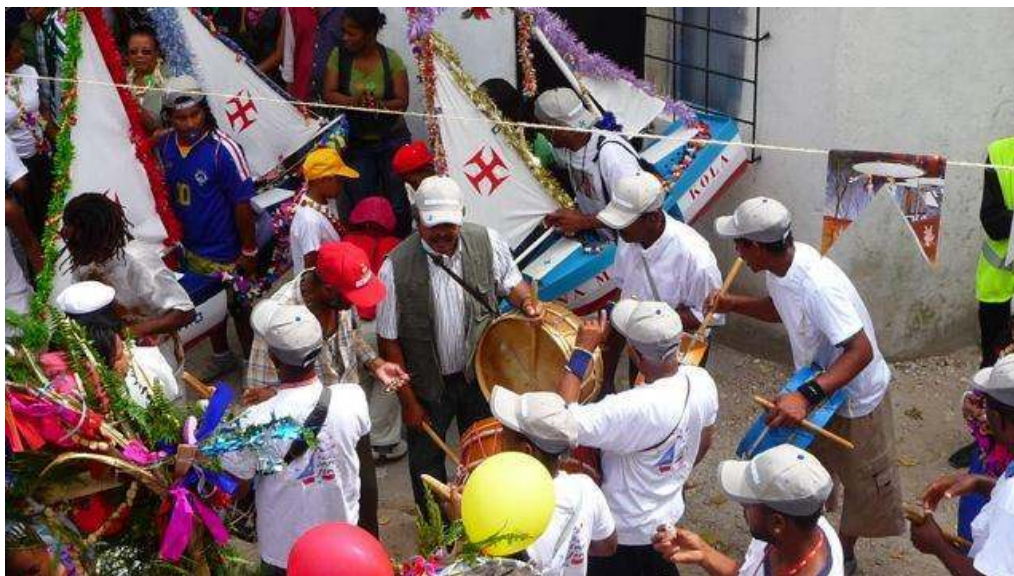
IMAGEM 3 – Cortejo da Festa de Kola San Jon no Bairro da Cova da Moura

27 de junho de 2009