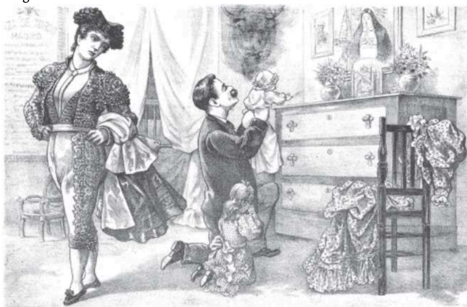
La mujer á torrear, y el hombre á rezar por ella.

100AD8F80000467000002FB2A1FED2F52B8F700C.emf