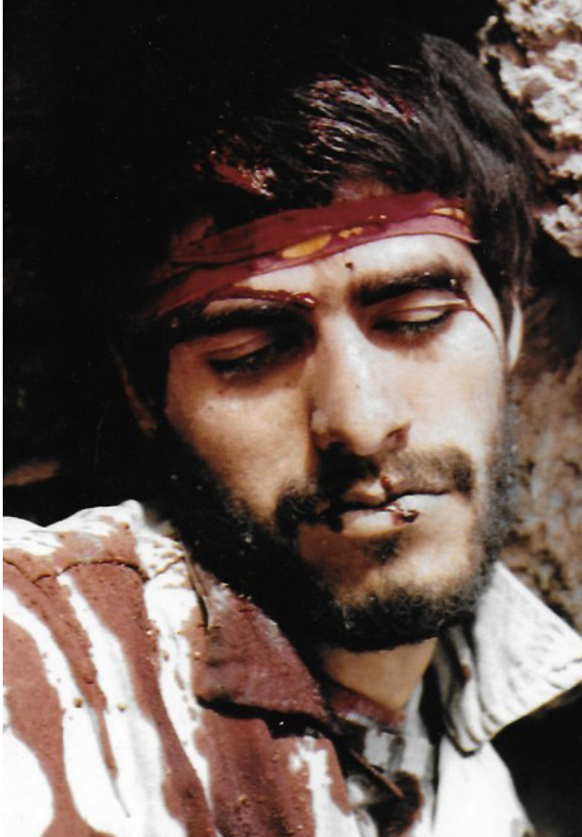
Fig. 4 – Célèbre portrait du martyr Amir Hâj-Amini, exposé à l'entrée Bâb ash-Shohadâ (poster d'une librairie située dans les divisions des martyrs)

Behesht Zahrâ dispose de huit entrées aux orientations géographiques diverses, la principale et la plus fréquentée étant celle du nord, nommée Bâb ash-Shohadâ (« la porte des martyrs »). Il s'agit d'un très grand portail métallique, surveillé par des militaires. Au-dessus de cette entrée est calligraphié le célèbre verset coranique (III, 169) : « Ne crois point que sont morts ceux qui ont été tués sur le chemin d'Allah ! Au contraire ! Ils sont vivants auprès de leur Seigneur, pourvus de leur attribution 17 , », au-dessous duquel sont dressés de nombreux drapeaux nationaux. Derrière ce portail, de l'autre côté, est exposé le célèbre portrait de Amir Hâj-Amini représentant le martyr en grande taille.