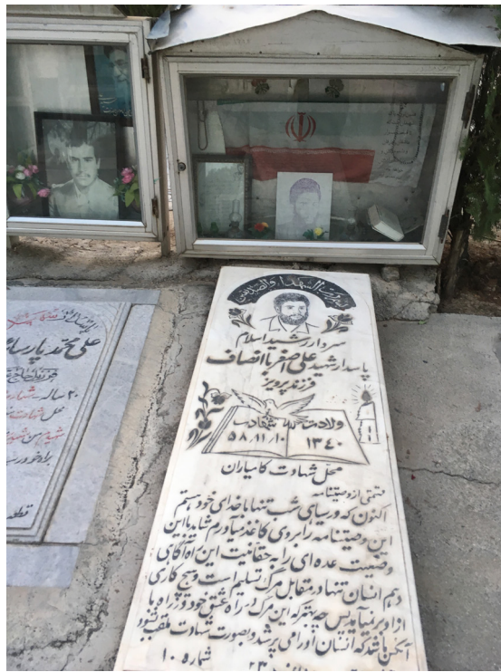
Fig. 6 – Exemple de pierre tombale à Behesht Zahrâ.

La partie basse de la pierre est souvent consacrée à un passage du testament de la personne dont le contenu montre très clairement l'esprit et la mentalité du martyr.