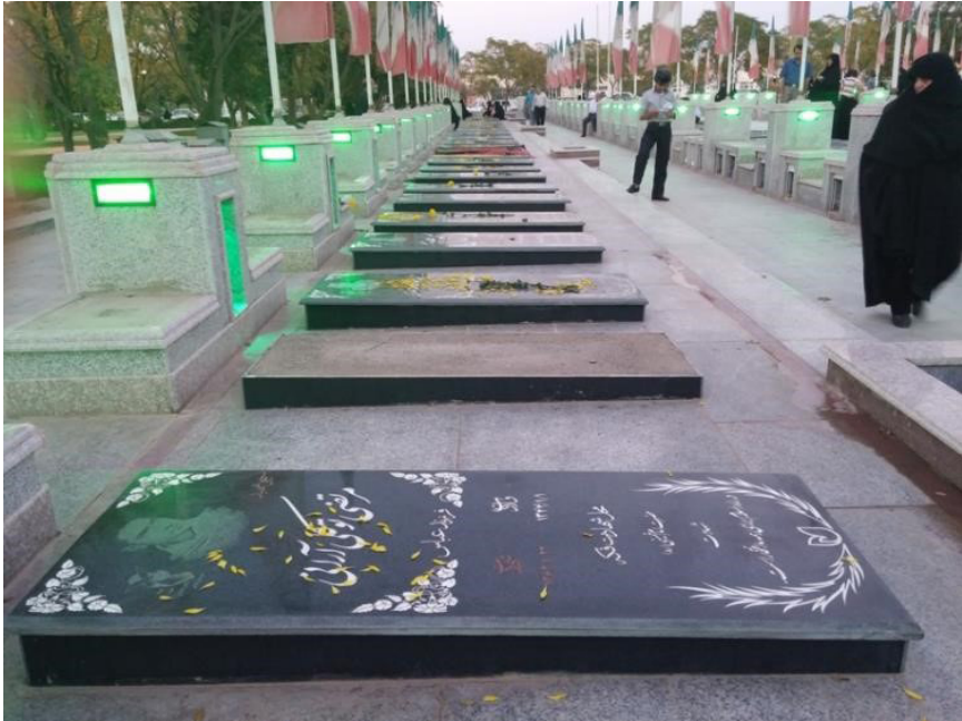
Fig. 10 – Les tombes uniformisées des martyrs de la guerre Iran-Irak du cimetière de la ville de Kāshān, 2014

Ainsi en l'espace de dix ans, plus de 12 000 cimetières ont été uniformisés : toutes les pierres sont désormais de la même couleur, taillées dans la même matière; les inscriptions sont harmonisées; les boîtes miroirs et toutes les autres singularités qui reflétaient les liens personnels entre un martyr et ses proches ont été supprimées. Dans certaines divisions, des projets paysagistes ont provoqué le déplacement de certaines pierres par rapport aux tombes, chose bien problématique du point de vue du culte des morts dans la tradition populaire 38 .