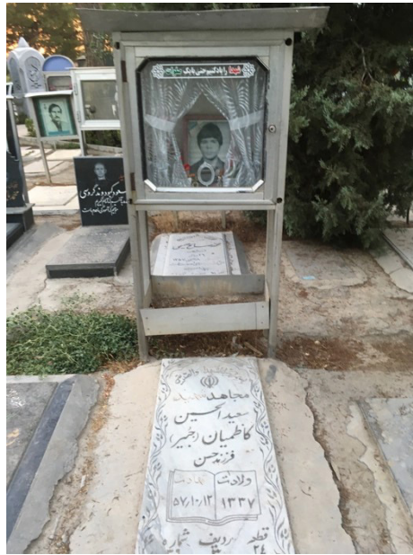
Fig. 7 – Tombe de martyr au cimetière de Behesht Zahrâ, avec sa boîte-miroir et sa photo exposées vers l'extérieur – © S. Parsapajouh, 2015.

Elle est comme une petite niche dans le mur ( tâqceh ) où les mères rassemblent traditionnellement leurs objets personnels.