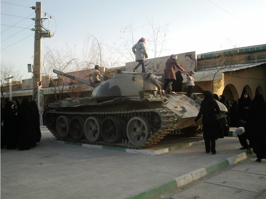
Fig. 5 – Ancien char de guerre qui sert de terrain de jeu pour enfants, situé près de la Maison du martyr

de certains martyrs (photos, testaments, Coran de poche, lunettes, keffieh, bottes, etc.) sont rassemblées dans de simples vitrines; un centre d'archives concernant les martyrs; deux salles de projection et de réunion, et une librairie vendant livres, films, musiques, images et mêmes jouets, autour de la mémoire de la « Défense sacrée ». À l'extérieur, une salle nommée Mahdiyeh est dédiée aux invocations collectives et officielles – comme la récitation de Ziyârat-e 'Ashurâ tous les jeudis soirs, ou de Do'â-ye Nudbeh tous les vendredis matins – puis, plus loin, un ancien char de guerre sert de terrain de jeu à de nombreux enfants.