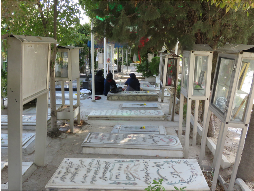
Fig. 2 – Exemples de tombes de martyrs avec divers ornements. En arrière plan, deux sœurs et leurs mère, se sont recueillies sur la tombe de leurs frère. Divisions des martyrs, Behesht Zahrâ, 2016

Une mère de martyr prend la parole avec force et conviction, et dit avec éloquence :