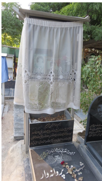
Fig. 8 – Tombe de martyr au cimetière de Behesht Zahrâ, avec la boîte-miroir recouverte de l'extérieur – © S. Parsapajouh, 2016.

On attribue des pouvoirs surnaturels à ces martyrs, aussi bien de leur vivant qu'après leur mort. Comme cette mère qui dit :