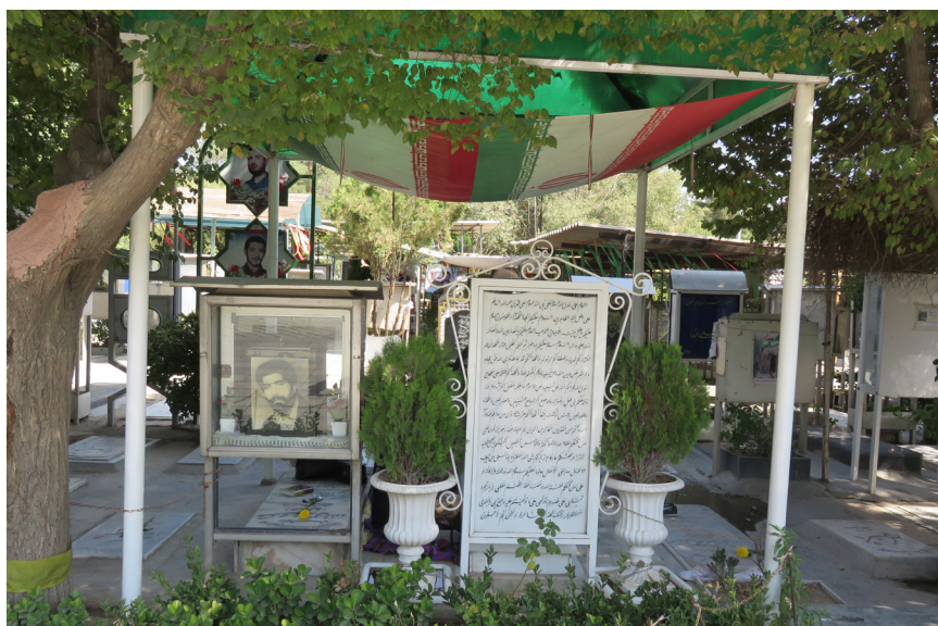
Fig. 1 – Trois tombes placés sous le drapeau national. Au centre de la photo, un texte de salutation adressé au Prophète, aux imams et aux martyrs, pris de textes canoniques de la visite pieuse ( ziyâra ), gravé sur pierre. Divisions des martyrs, Behesht Zahrâ, 2016.

distribuent des tracts dénonçant le projet d'aménagement des tombes des martyrs et incitent à la mobilisation de tous contre l'injustice que les familles de martyrs, si attachées à la tombe de leurs enfants, risquent de subir. Un homme s'exprime dans un haut-parleur, accusant les autorités qui ont l'intention de déposséder les familles de la tombe de leur fils. Une foule grandissante s'attroupe : des dizaines de femmes sont assises sur un vaste tapis, étendu sur les tombes de la division ; des dizaines d'hommes s'agitent autour d'elles. Tout se passe devant une sorte de tribune « bricolée » : les gens sont survoltés, prennent la parole à tour de rôle pour témoigner de leur attachement aux tombes, de la place qu'elles occupent dans leurs vies et dans leurs souvenirs, dénoncent furieusement la décision exécutive, qu'ils qualifient d'autoritaire, pour le « réaménagement » des tombes. Ils accusent l'État d'opprimer des familles de martyrs, dévoilent les intérêts financiers et politiques 5 dissimulés par cet acte. L'allure et le ton des jeunes hommes, qui ajoutent à la confusion, rappellent l'époque de la guerre : c'est comme si la distance de trois décennies avait soudain été supprimée. Alors qu'un large pan de la société a depuis pris beaucoup de distance avec cette martyrologie 6 , eux dénoncent le pouvoir au nom de la mémoire des martyrs, de leurs propres martyrs.