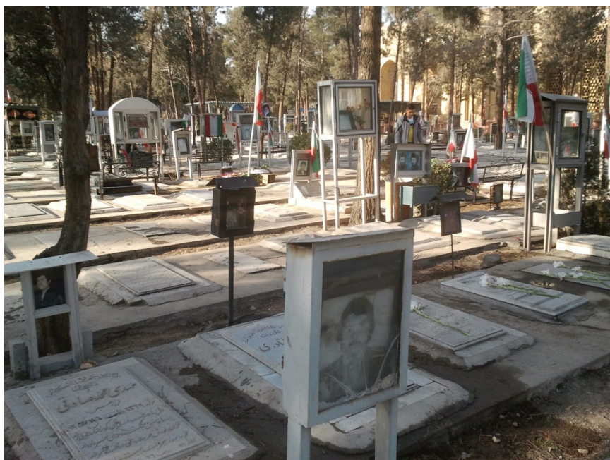
Fig. 9 – Les divisions des martyrs du cimetière de Behesht Zahrâ, 2016 – © S. Parsapajouh, 2016.