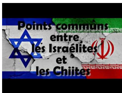
Figure 2 – Mise en scène du thème du « complot judéo-chiïte » : montage photographique extrait d'une vidéo suggérant un projet de domination mondiale commun aux « Israélites » et aux « Chiïtes »

Les Sionistes (extrémistes juifs) sont soupçonnés d'avoir établi un programme secret nommé « le protocole des sages de Sion » qui avait pour objectifs de s'installer en Palestine, de prendre le pouvoir sur la finance mondiale et de diriger le monde avec leur Messie. Quant aux Chiïtes, ils dissimulent, à travers la Taqiya, leur programme nommé « le protocole des mollahs de Qom », qui a pour objectif de propager le chiïsme dans le monde musulman afin d'établir des bases pour l'arrivée du Mahdi, et ce dernier se chargera ensuite de soumettre la planète à ses pieds. (Ahmed Miloud, « Le chiïsme doctrine antiislam », site web Islamvraiereligion, 12 février 2017, [consulté en septembre 2018] : http://islamvraiereligion.over-blog.com/2017/02/le-chiisme-doctrine-anti-islam.html )