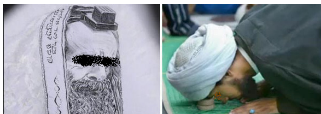
Figure 1 – Mise en scène du thème du « complot judéo-chiite » : montage photographique

Au moment de prier, les Juifs mettent sur leur front des « Tefilines », une petite boîte contenant des morceaux de parchemin pour ne pas oublier les commandements. Au moment de Prier, les Chiites mettent sur le sol la « Turbah de Hussayn », qui est un morceau de Terre de Kerbala. Lors de la prosternation, leur front doit toucher ce morceau de terre, pour ne pas oublier le martyr de Kerbala. (Site web convertistoislam, 4 décembre 2010 : « Troublants points communs entre les chiites Rāfidhites et les juifs/Chrétiens », consulté en septembre 2018, [ http://www.convertistoislam.fr/article-quel-est-le-point-commun-entre-les-shiites-et-les-juifs-54744869.html ]).