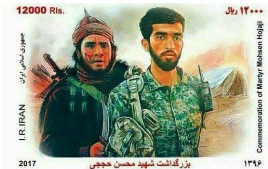
Photographie 5 – Timbre iranien de 2017 à l'effigie de Mohsen Hojjaji

de Hojjaji, toutes sortes de produits dérivés se répandent dans l'espace public : de la carte de mariage à son effigie au cartable de classe, en passant par les clips musicaux, jusqu'au timbre-poste (photo 5).