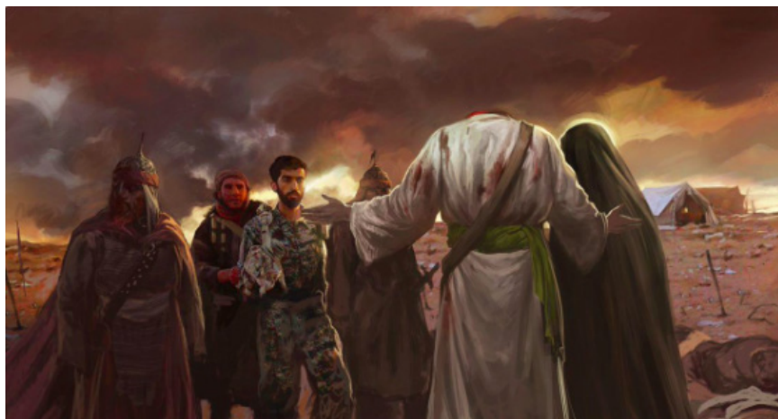
Photographie 3 – La capture de Mohsen Hojjaji

À droite du cadre gît un cadavre à terre (celui vu dans le film). Hojjaji est le seul à être au présent avec son uniforme, les autres appartiennent à l'imagerie de Karbalâ (photo 3).