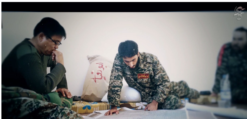
Photographie 2 – Image extraite du film Seyyed Ebrahim – © Réalisateur, Sâsân Fallâhfar, 2015