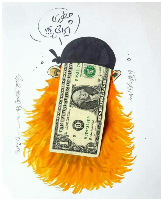
Photographie 4 – Caricature de Mohammad Rezâ Mirshâh, inspirée du film À l'heure de Damas – © Rezâ Mirshâh, 2018

Située sur un territoire qui n'est pas l'Iran, la guerre reste lointaine. Même les deux attentats de juin 2017 qui ont touché le Parlement et le mausolée de l'Imam Khomeyni n'ont pas instauré massivement l'idée d'une patrie en danger. Les films qui ont tenté de le faire ne semblent pas avoir eu non plus cet effet-là, que se soit dans Les Iraniens hérétiques (2014) qui montre des membres de l'EI proclamant que leur objectif suivant est d'attaquer l'Iran, ou À l'heure de Damas (2018) qui brandit la même menace. En revanche, la patrie devient véritablement en danger quand, après s'être retiré le 9 mai 2018 de l'accord sur le nucléaire (signé en 2015), le président américain rétablit une série de sanctions contre l'Iran. L'économie iranienne est touchée de plein fouet et la monnaie nationale s'envole (printemps-été 2018). Les représentations de l'EI dans le film de Hâtamikiâ À l'heure de Damas prennent alors, dans les mains des caricaturistes de presse qui s'en inspirent, le visage du dollar américain, montrant la véritable menace qui touche directement l'Iran (photo 4).